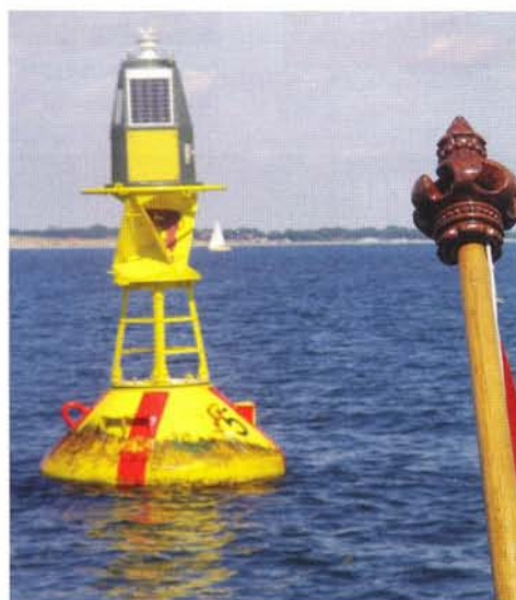
De hoekboei van het sperrgebiet.

In de loop van de nacht neemt de wind af. Bij het aanbreken van de dag staat er een matige wind uit alle hoeken. Wat we ook proberen, de koers tot aan de hoekboei van het Sperrgebiet is niet bezeild. Over de marifoon horen we een medewatersporter roepen, hij meent dat zijn schip in het vrije water in aanvaring is gekomen met een mijn. Zorgvuldig sturen we buiten het militaire oefenwater en ontdekken in 3,5 uur dobberen een voordeel van windstille op de Oostzee. In het vlakke water zien we bruinvissen. We naderen Kiel, een feest van herkenning. De Nederlandse chartervloot zet de toon. We vinden een ligplaats in de haven van Möltenort, tegenover de ingang van het Kieler kanaal. Een havenfeest overschreeuwt ons afscheid van de Oostzee. Het is