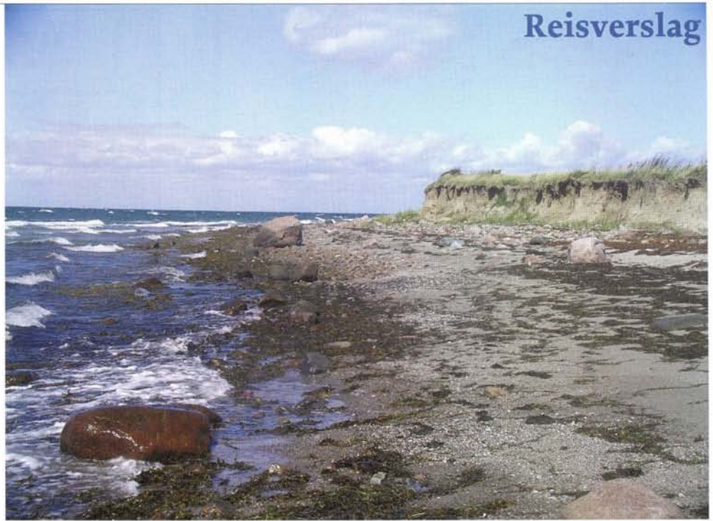
Lopen langs de kust die bezaaid is met rotsen.

steek van de Grote Belt moet maar op de motor. En dan modderen we met halen en brengen, hollen en stilstaan, wind uit westelijke richtingen in de richting van Lundeborg, waar donkere wolken zich samen pakken. We worden min of meer overvallen door een harde windstoot gevolgd door een droge donderslag. In allerijl schieten we onze reddingsvesten aan en in een oogwenk liggen fok en kluiver op het dek. Twee donderklappen verder vertrouwen we het weer echt niet meer. De motor gaat aan; op naar Lundeborg. Een grijze regenachtige dag volgt. De jol is weer schoon en droog, de wind is west, 3-5 Bft. Volgens onze berekeningen loopt de stroming zeker tot in de middag in zuidelijke richting. De kans op een mooie zeildag is groot. En toch willen we eerst diesel tanken bij de zelftank. De Deense gebruiksaanwijzing is voor ons wat lastig