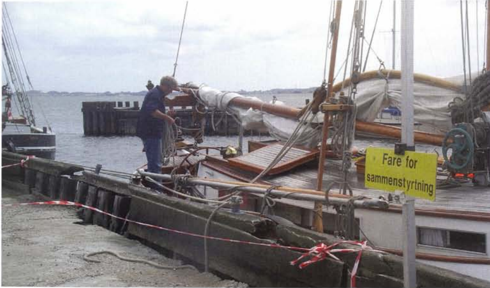
Er is gevaar voor instorting.

we aan op een wrakkige kade van een vervallen haven. In de avond gaat de wind liggen. De sfeer op het eiland is gemoedelijk, weinig toeristisch. Ook op Strynø komen alle geasfalteerde wegen uit in het dorp. Op het land wordt geploegd en geoogst. In het omringende water wordt gevist. Naast de grote kerk staat een schitterend vakwerkhuis, maar er is ook achterstallig onderhoud en leegstand in het dorp. Het is of de tijd er stil staat. Roestige ringen bij de aanleg van de pont getuigen van het tegendeel. In de vroege ochtend staat op de havenkade een file: 10 auto's rijden achterwaarts de pont op.