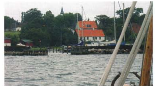
De haven van Nyord.

smalle haveningang gemarkeerd door een rood licht en dat helpt wel om de haven veilig binnen te kunnen lopen. Het oude vissersdorp Nyord lag tot 1968 op een eiland. Tot die tijd voorzag de gemeenschap zich volledig in de eigen behoeften. Nu is daar het toerisme bij gekomen. Af en toe schijnt de zon. In buien trekt de wind wat aan. We wandelen over de weg door het buiten-