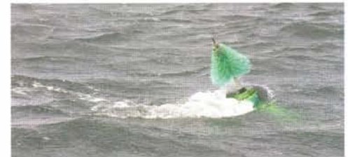
Boeien worden soms bijna onder water getrokken.

te volgen. We voeren het apparaat 400 kronen en ontvangen een tegoed bon; geen diesel dus. De dame van de kiosk is zo aardig om ons te hulp te schieten waardoor we toch met volle tank en vol tuig op weg gaan naar Strynø. Wind en stroming nemen in de loop van de dag verder toe. Het gaat hard genoeg en we besluiten de kluiver weg te halen. Bij de brug is het even zoeken naar boeien, en dan is de koers naar Strynø niet meer bezeild, dus strijken we de zeilen. Het laatste stukje varen we op de motor en na 3 uur varen leggen