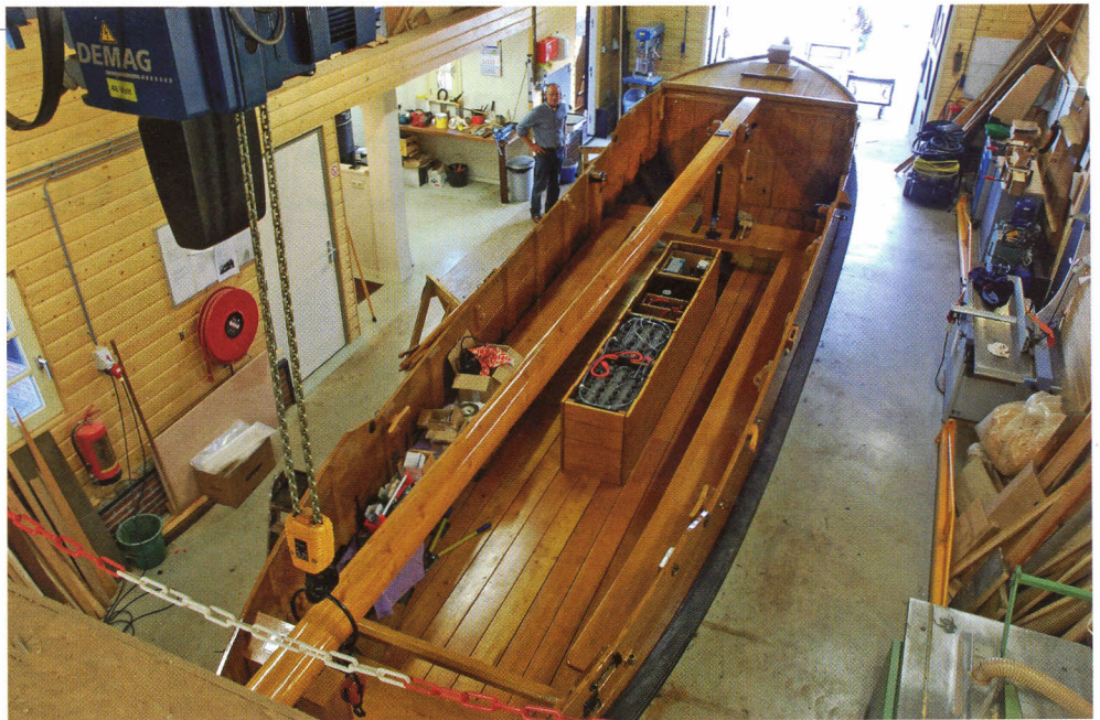
De nieuwe zomp De Vriendschap, in de goed geoutilleerde werf. Midden in het ruim staan de accu's opgesteld.

Als de wind meezit kan de mast hydraulisch omhoog worden gezet en het zeil worden gehesen. Er kunnen 25 passagiers mee in de zomp en 's zomers worden met alle zompen tochten door het prachtige vaargebied van Enter, Regge en Berkel gemaakt. Om het vaargebied nog wat te vergroten zijn bij Zuna en bij Hellendoorn overtoeren gemaakt, waarbij de zomp op een lorry op rails vaart en dan elektrisch over de weg wordt