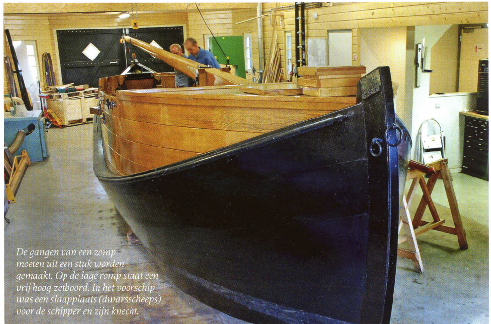
De gangen van een zomp moeten uit een stuk worden gemaakt. Op de lage romp staat een vrij hoog zetboord. In het voorschip was een slaappleats (dwaarscheeps) voor de schipper en zijn knecht.

gereden en aan de andere kant van de dam weer in het water rijdt en verder kan varen. In de maanden juli en augustus wordt er dagelijks, behalve op zaterdag en zondag, gevaren van 11.00 tot 16.00 uur. Groepen met maximaal 25