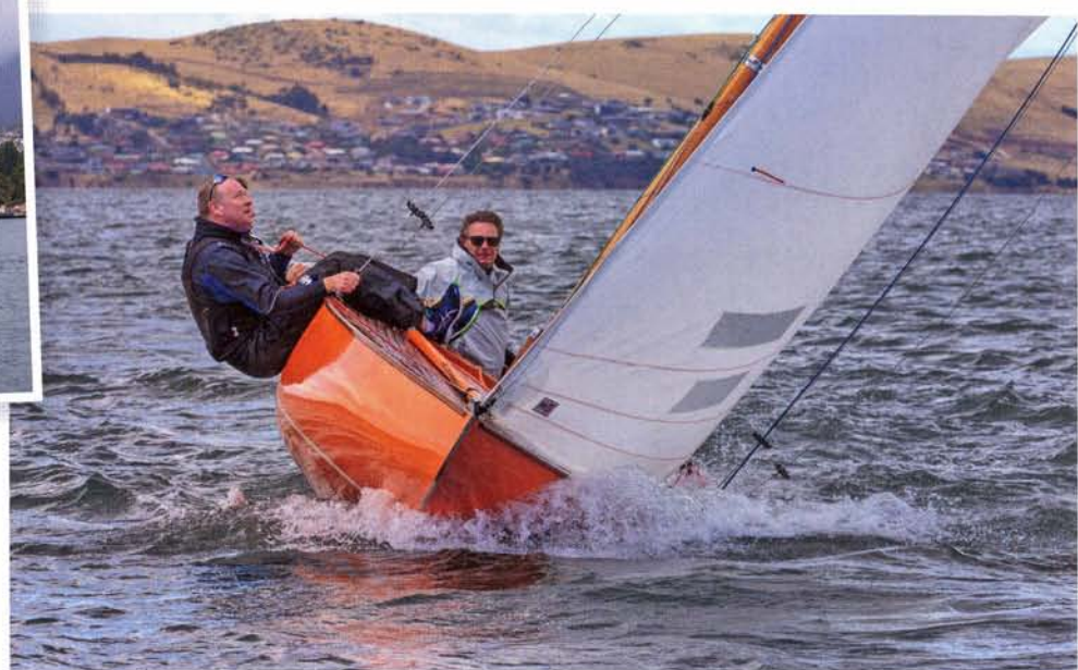
boven en rechts: De matchrace tussen de Regenboog Oranje en de Derwent-klasse Gnome is één van de hoogtepunten van het festival, ook voor sponsor Damen, die in de tweede heat het team Diephuis aan boord komt versterken