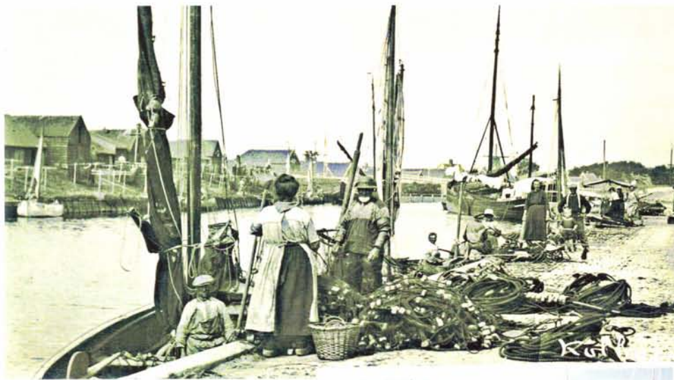
De Ansjoviskade in 1925. De jol links op de voorgrond is (hoogstwaarschijnlijk) de KH 44. Aan de overkant zijn op de Westfriese zeedijk de turfschuren en de stellingen voor de netten te zien

linksonder: De KH 44 weer helemaal origineel