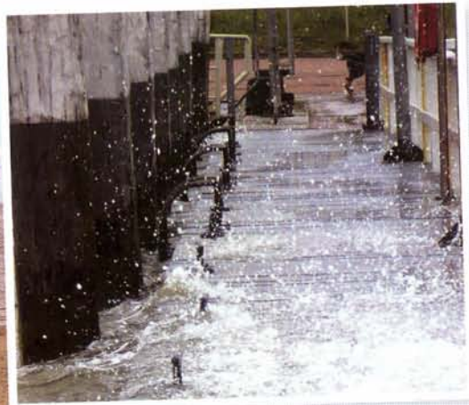
links: Verrassing, aan de westpunt van Spiekeroog is een mooie ankerbaai ontstaan