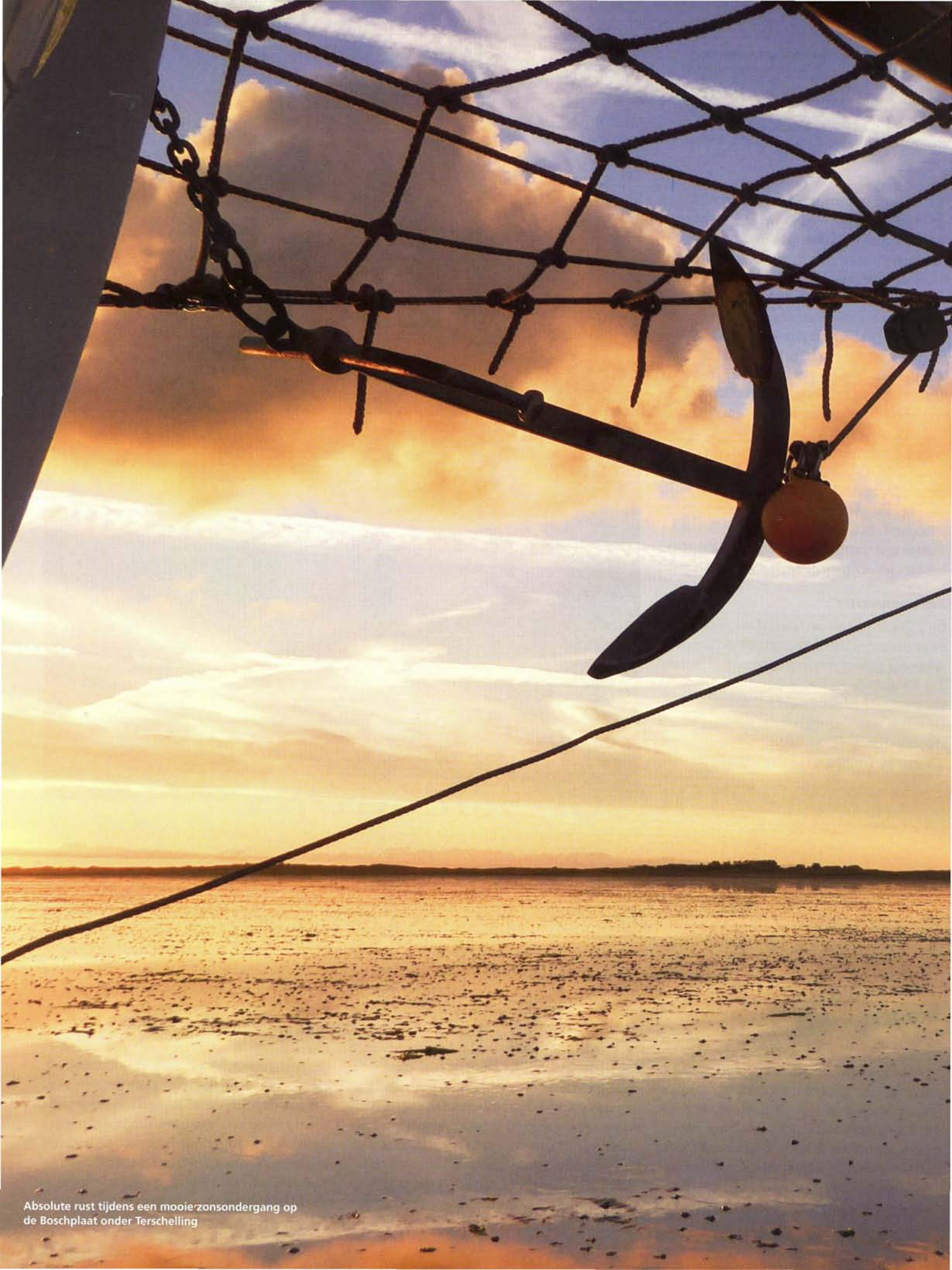
Absolute rust tijdens een mooie zonsopgang op de Boschplaat onder Terschelling