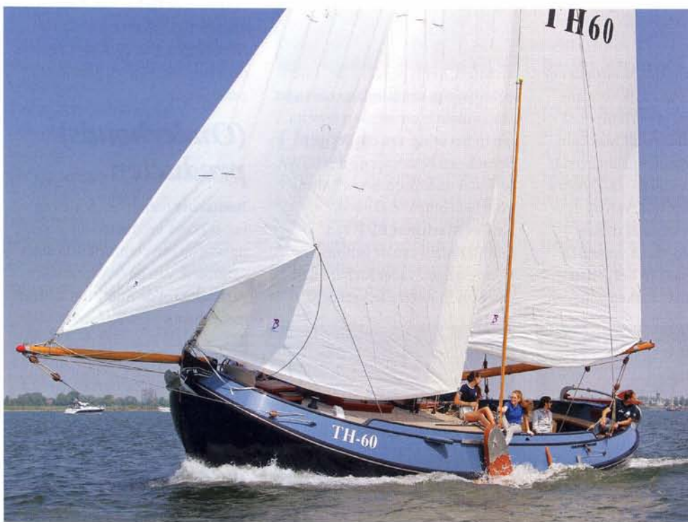
links: Kenmerk van Van Duivendijk die uiteraard zelf rondhouten maakt: de rood gelakte afgeronde top van boegspriet en giek. Het Delta anker voor de steven is nodig vanwege de 'Zeeuwse harde grond'

te snijden, iets wat de dampdichtheid ten goede komt. 'Die isolatie scheelt natuurlijk enorm, zowel bij koudere alsook warmere temperaturen.'