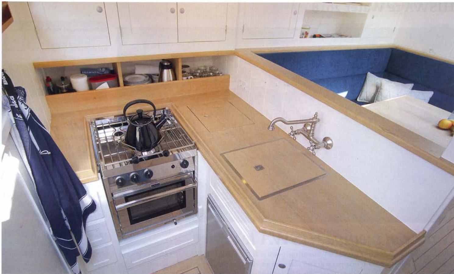
boven: De kombuis met legio kastuimte, de natte cel ligt er tegenover, aan stuurboord