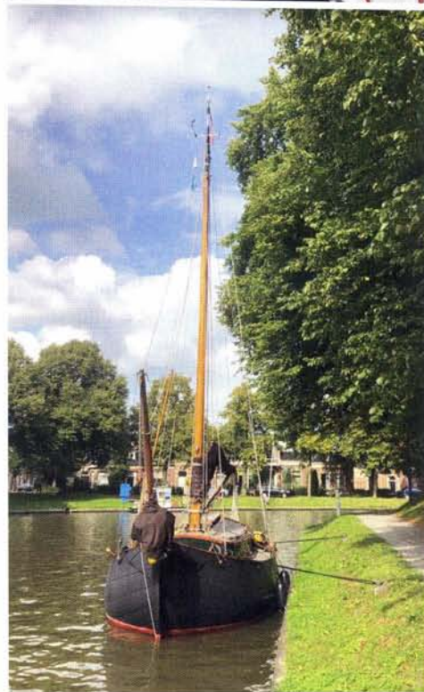
kaderfoto links: Tjalle van der Sluis aan het helmhout van zijn jol