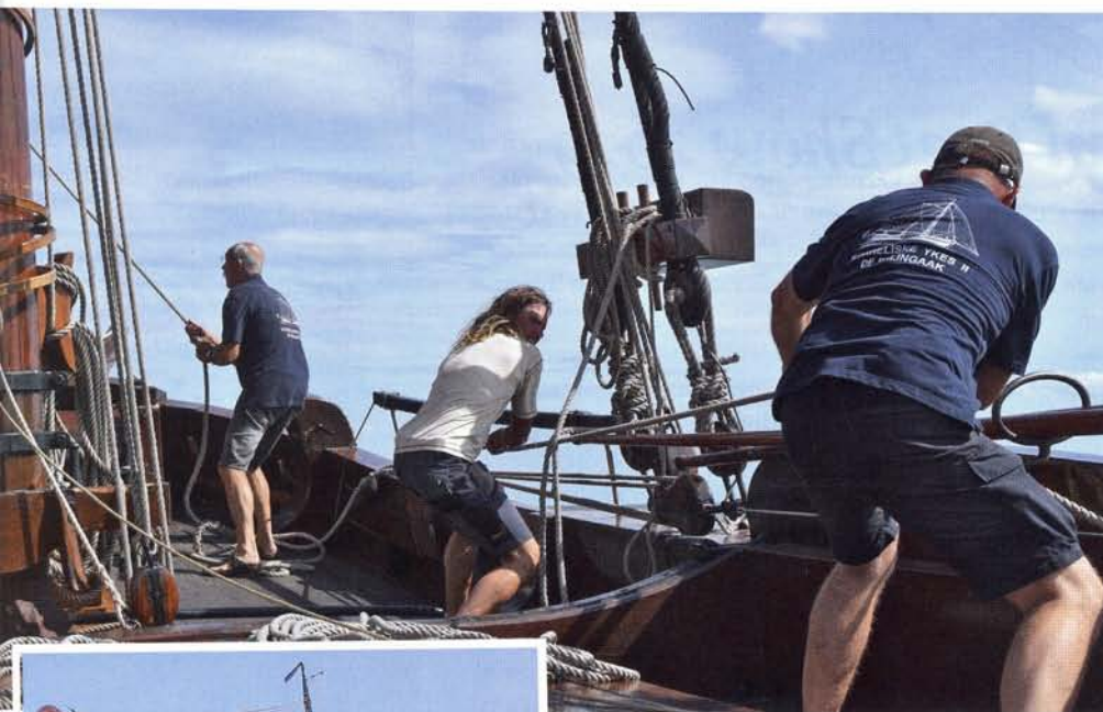
boven: Bemanning en vrijwilligers zijn al aan het oefenen om de tocht over zee te ondernemen

De reis naar Londen kost geld. Sponsoring in natura door bedrijven draagt al veel bij aan het mogelijk maken van deze reis. Financiële bijdragen evenzo, maar om alle kosten te dekken, kan Stichting De Palingaak nog steun gebruiken, ze heeft daarvoor een leuk initiatief bedacht. Het reisplan ziet er als volgt uit: Heeg-Londen-Ramsgate-Oostende-Scheveningen-Oudeschild-Heeg. De palingaak legt daarmee in totaal 565 mijl af (265 mijl heen en 300 mijl terug). Het publiek kan de Londenreis van de Korneliske Ykes II sponsoren door mijlen te kopen. Eén mijl kost 25 euro. Wie 6 mijl of meer koopt, kan in het najaar gratis een tochtje maken op de palingaak vanuit Heeg op het Heegermeer. Steunt u de reis met 10 mijl of meer, dan ontvangt u ook nog een boek met het beeldverslag van de reis. Op de speciale reiswebsite ( www.palingaaklondon.nl ) is te zien hoe men kan bijdragen. Daar is ook te volgen hoeveel mijlen de aak al kan afleggen met behulp van de toegezegde steun. Meer weten over de palinghandel vanuit Heeg? Zie artikelen in SdZ 1983.9, 1989.2 en 2000.1