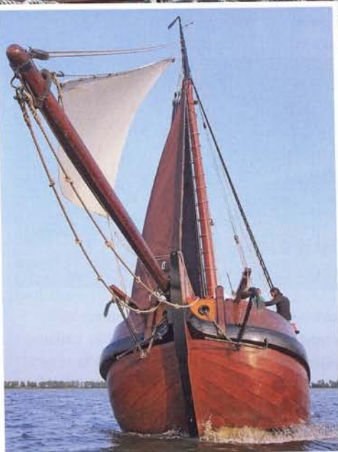
links: Vroeger werd met een "losse" boegspriet gevaren, maar voor de tocht over zee wordt toch gekozen voor een waterstag

Dijk. Maar deze hulp kan slechts tijdelijk zijn. Paling zou weer vrij en zelfstandig moeten kunnen migreren.