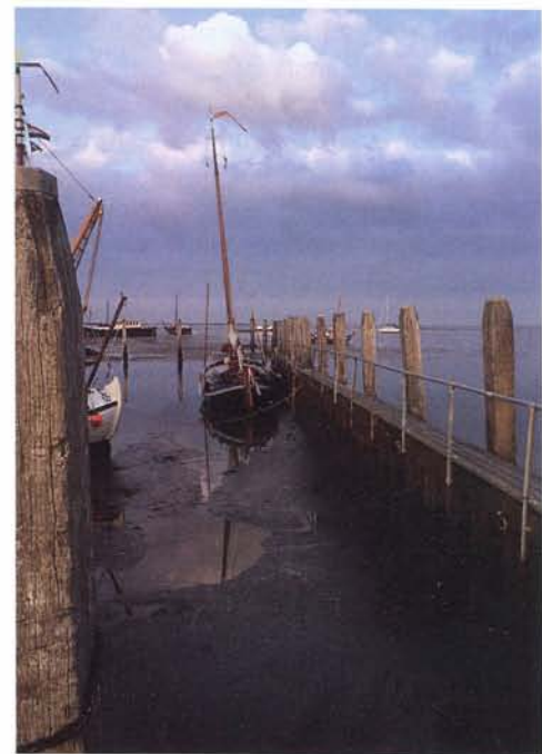
links: Met een kleine knik in de schoot wil de Dorada best hard zeilen