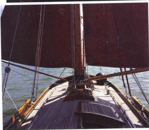
onder: Voor de wind zeilend met de botterfok te loevert

gezet. Maar nu moeten er wel weer nieuwe potdeksels worden gezaagd en goed met kit worden vastgelijmd. In feite heb je dan geen schroeven nodig en er is ook geen mogelijke bron van roest meer.