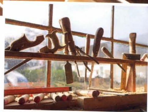
boven: Jan Schreur in de Oude Schuur met in de vesterbank allerhande gereedschap (onder).

Naast het bedrijf Punterbouw Schreur, run-