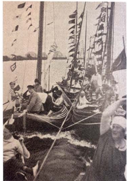
links: Gepavoiseerde schepen op een omslagplaat van de Waterkampioen in 1938. De aquarel was van J.A. Hesterman jr.