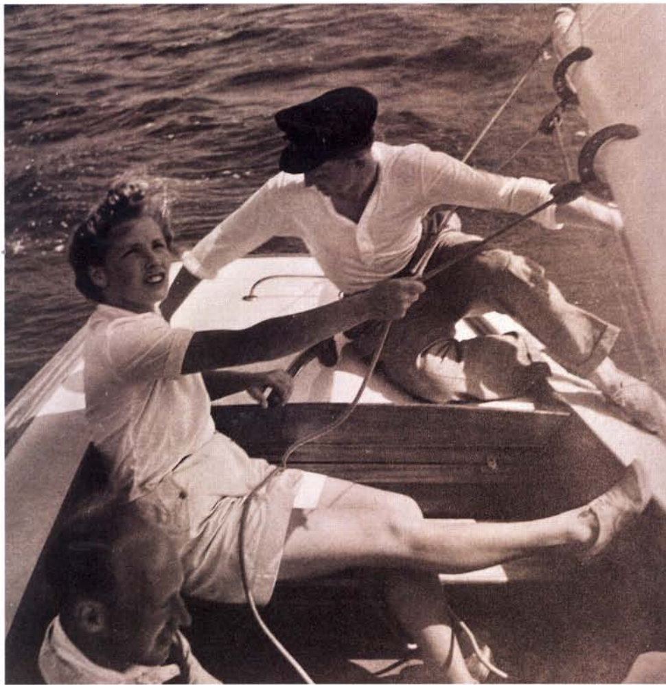
Foto uit een privé-archief waarin een jonge vrouw een ANWB-zeilcursus volgt van de EFZ, 1944