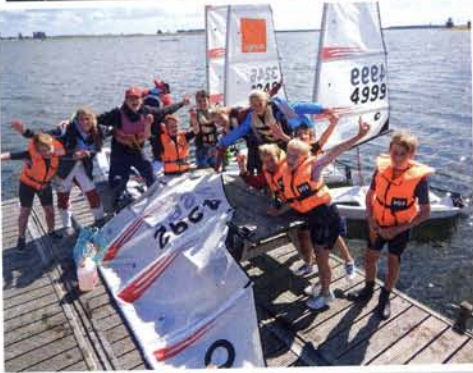
boven: Zeilles anno nu in de 16 m 2 op de Wijde Aa