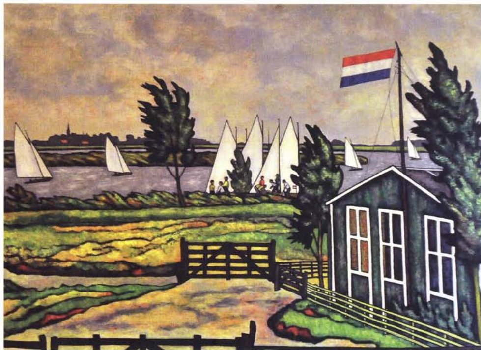
rechtsboven: Uitsnede uit een schilderij van Murk Kuipers, voorstellend een Vinea Domini Zeilkamp

links, van boven naar onder: Zeilles gevraagd door 2 dames;