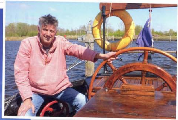
links: Met de nieuwe mast en giek van Ventis en de nieuwe zeilen van Zeilmaker Molenaar uit Grou is de Vlieland weer een plaatje!