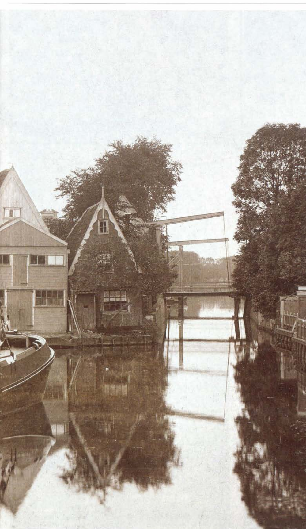
De werf in Edam gaat terug tot 1462, toch is deze foto bijna nog zo te maken

zoals blijkt uit een jaaroverzicht in het Dagblad Scheepvaart van 31 december 1895, twee 'paviljoen boeierschuiten' van stapel van respectievelijk 26 en 24 last. Eind negentiende eeuw staat een last voor twee ton. Dit is de boeierschuit van 24 last.