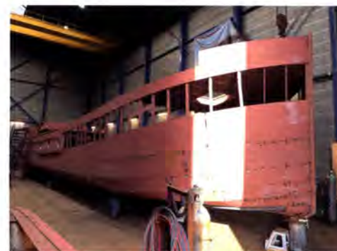
onder: Nieuw casco voor een Amsterdams niet-varend woonschip. De ruimte is enorm

weer onder zeil om er vervolgens tien jaar mee te charteren als schipper/eigenaar. Dat was ruim dertig jaar geleden. Daarna gooide hij het over en andere boeg met een bootverhuurbedrijf in Leeuwarden. Hoewel naast dat bedrijf ook de steventaak Aaltje Engelina lag.