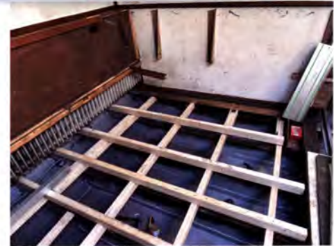
links: De klipper Isis krijgt een nieuw vlak bij SRF

Een deels vergelijkbaar verhaal als de Isis ligt in een van de hallen op het werfterrein. De Carpe Diem bleek ook een nieuw vlak nodig te hebben en bovendien was de techniek erg gedateerd. Het is een mooie tjalk die prima dienst kan doen als dagtochtenschip. Alleen, er was in de staat waarin het verkeerde geen koper voor te vinden. Nu investeert SRF er het nodige in om het weer terug te kunnen brengen in de chartermarkt. Dat