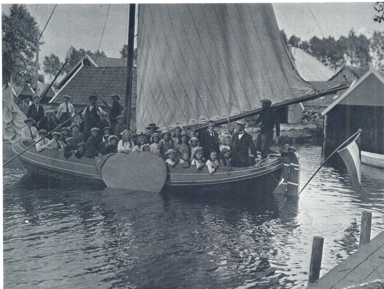
De 'Prinses Juliana' met zeker 40 man aan boord, klaar voor de rondvaart.