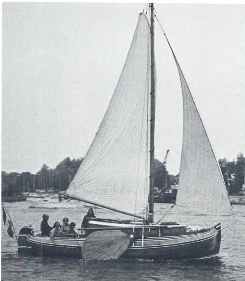
De 'Prinses Juliana', thans met kajuit onder de naam 'Johan Willem Friso'.

De 'Prinses Juliana' was volgens het Jachtregister in 1925 nog in het bezit van de firma Visser.