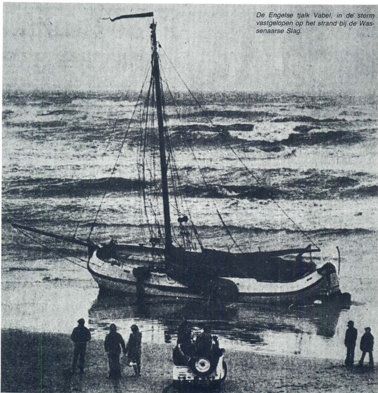
De Engelse tjalk Vabel, in de storm vastgelopen op het strand bij de Wassenaarse Slag.