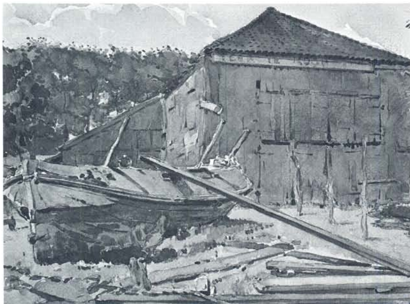
De werf van Van der Zee te Joure. Aquarel van Dirk de Vries Lam.

De rest van de zomer van 1953 zeilden wij en onze kinderen met de 'Aurelia', soms pompende om droog te blijven, maar toch met het grootste genoegen. Het koper was blank geworden en het snijwerk, dat zowel de bedel- als de hennebalk siert, van de overtollige verf ontdaan. Het bleek ons verder, dat een vrij ingrijpende restauratie noodzakelijk was en wij vonden de heer J.Y. de