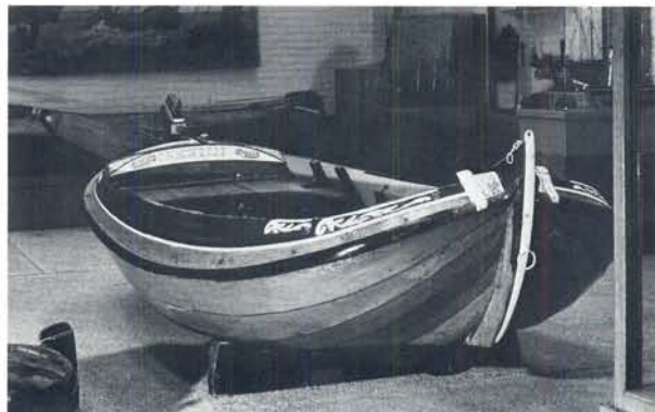
Het 'boeiertje Jannetje' gebouwd in 1921 door Auke van der Zee. Thans eigendom van het Fries Scheepvaart Museum te Sneek.