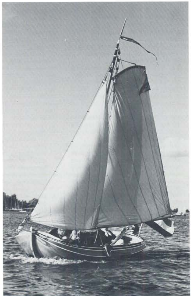
'Aurelia' zeilend op de Grouwster wateren.