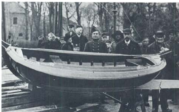
Het 'Wilhelmina-Bootje' in 1892 gebouwd voor de stad Leeuwarden in verband met het bezoek van H.H.M.M. Emma en Wilhelmina.