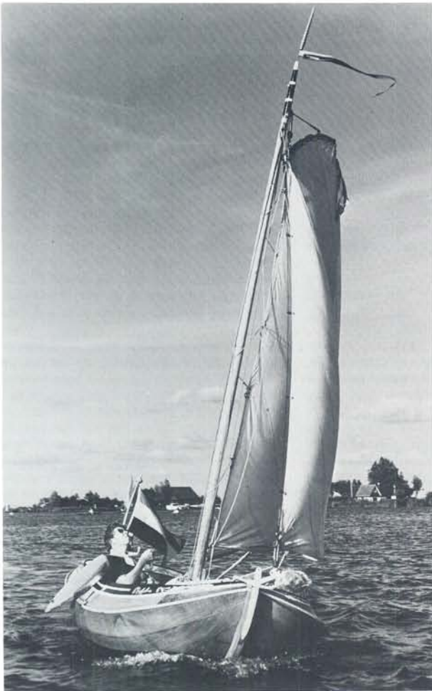
'Aurelia' met masttop en fraaie vlaggenstokknop op het Pikmeer te Grouw.