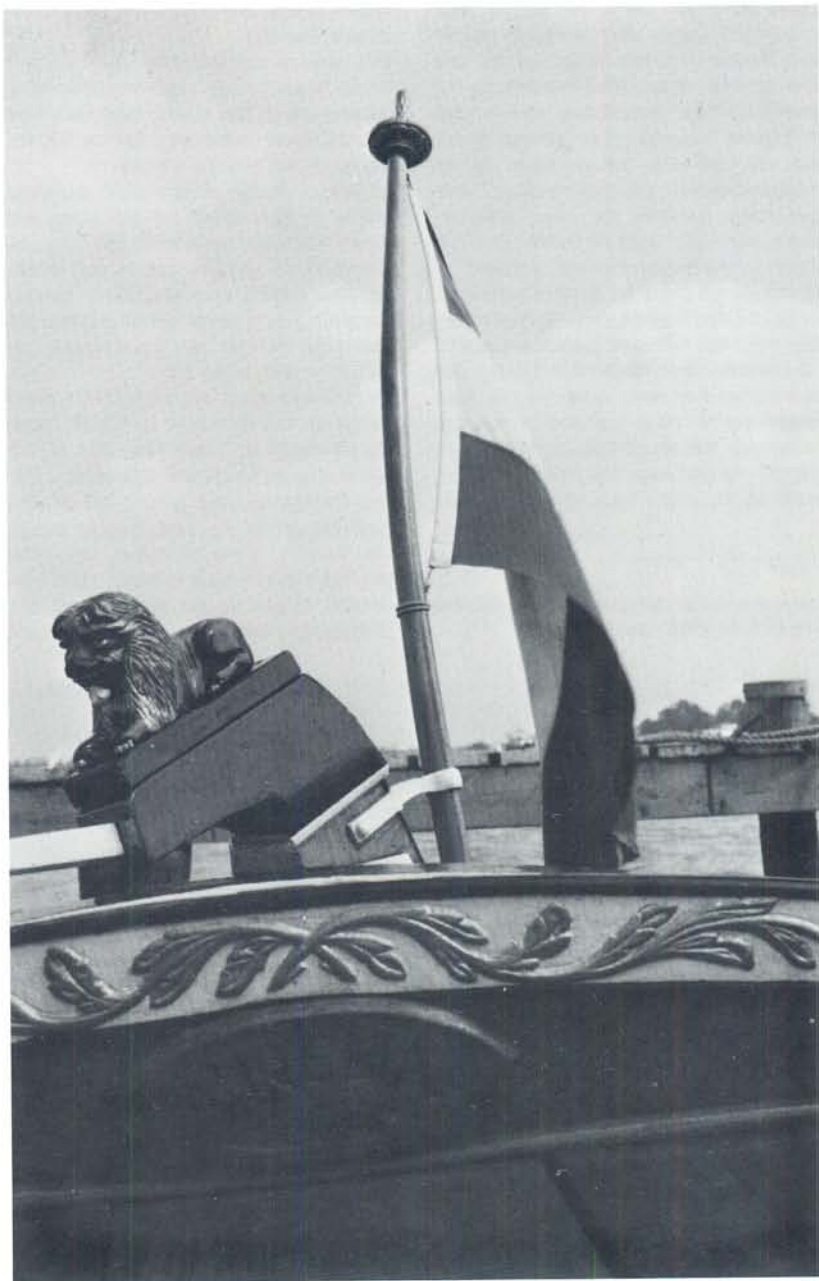
Hennebalk en roerleeuw met het naam- plaatje: 'Aurelia 20 juni 1883'.