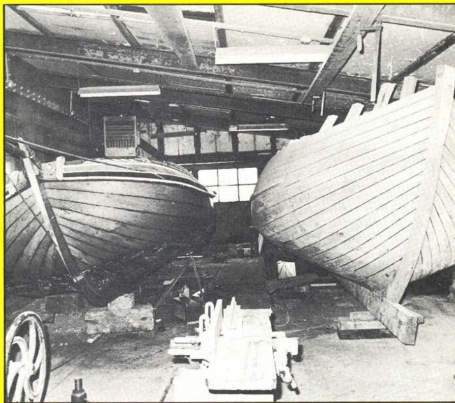
Nieuwe Staverse jol naast een oud fries jacht