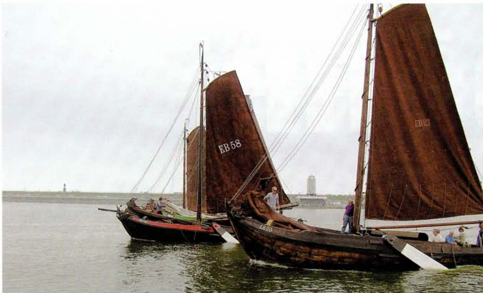
10 juni 2007 om 15.00 uur. De plechtigheid gezien vanaf het officiële schip de Noord-Holland. Tijdens het passeren van dit schip werd in groepjes van vier schepen de fok gestreken als eerbetoon aan de verdwenen Zuiderzeevisserij. Op de achtergrond het Monument (op de plaats waar dijk in 1932 werd gesloten).

wat samen met de Zuiderzee verdwenen is door de aanleg van de Afsluitdijk. In het bijzijn van het schip Noord-Holland van Rijkswaterstaat met daarop de Commissaris van de Koningin en de burgemeesters van Wieringen en Wonseradeel streken de deelnemende schepen gelijktijdig de fok om deze na passen weer te hijsen. Het was een goed gevoel dat na alle festiviteiten rond het 75-jarig bestaan van de Afsluitdijk nu ook werd stilgestaan bij alles wat door de Afsluitdijk verloren is gegaan.