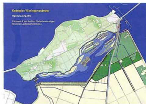
Een van de varianten voor het Wieringer randmeer

Vóór de Zuiderzeewerken lag de havengebonden bedrijvigheid voornamelijk in de haven van De Haukes. Postboot, beurtschepen, visserij en visafslag zijn allemaal verdwenen, ondanks de uitbreiding van de haven door de aanleg van de Wieringermeer in 1930. De Haukes is nu een jachthaven aan het Amstelmeer. Er is nog een scheepsreparatiebedrijf en er zijn twee watersportverenigingen. Toch zijn er nog herinneringen aan vroeger. Het lokale café heet nog steeds De Postboot. Ook de havenmeesterwoning uit 1891, toen de haven werd aangelegd, staat er nog. Het gebouw is nu in gebruik voor de watersport. Er is zelfs nog visserij; elke dag vaart er nog een palingvisser, de WR 35, vanuit De Haukes uit over het Amstelmeer. Maar wie weet, misschien is er weer toekomst voor De Haukes. Als het hierna beschreven plan doorgaat zou De Haukes via het randmeer weer een verbinding met het IJsselmeer krijgen en daarmee aan de scheepvaartroute route naar Den Helder komen te liggen.