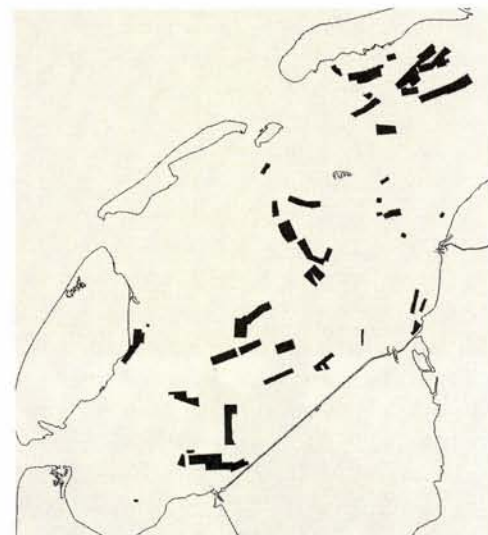
Mosselpercelen in de westelijke Waddenzee in 2001. Noordelijk van de Afsluitdijk is in 90 jaar minder veranderd dan men misschien zou verwachten. Wel is een toename te zien bij het Inschot, het Zuidostrak en onder Terschelling.

De garnalenvisserij in de Waddenzee bleek voor de Wieringer vissers lucratiever. Voor de gehele Waddenzee zijn er in totaal negentig vergunninghouders (GK-vergunning); de Wieringer vissers hebben er op dit moment achtien in hun bezit. Vanaf 1950 heeft de garnalenvisserij zich steeds verder ontwikkeld en nam voor een deel de plaats in van de visserijen die door de afsluiting verdwenen waren. In de jaren tachtig en negentig ontwikkelde Den Oever zich tot een van de grootste garnalenaanvoerhavens van Nederland. In sommige jaren zelfs de grootste, zoals in 1995 met een totale aanvoer in Den Oever van 2.750.000 kilo.