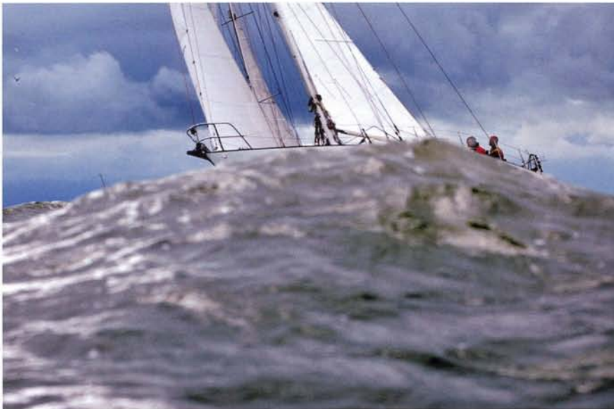
De camera droog houden bleek lang niet altijd mogelijk.

grafen binnen de watersportwereld geweest. In zijn woonkamer met uitzicht op de Geau vertelt hij over zijn werk als maritiem fotograaf. 'Dat hele fotograferen is uit liefde voor het varen ontstaan. Dat begon toen ik als kind met mijn vriendje Kees mee mocht met de BM van zijn vader op het Spaarne. Ik heb later ook nooit een eigen fotostudio gewild, ik wilde vooral lekker varen. Het begon ermee dat ik naar zeilwedstrijden toe ging en daar allerlei mensen leerde kennen. Een daarvan was een man die Yamaha motoren importeerde en zich afvroeg hoe hij die aan de man kon brengen. Ik had wel een