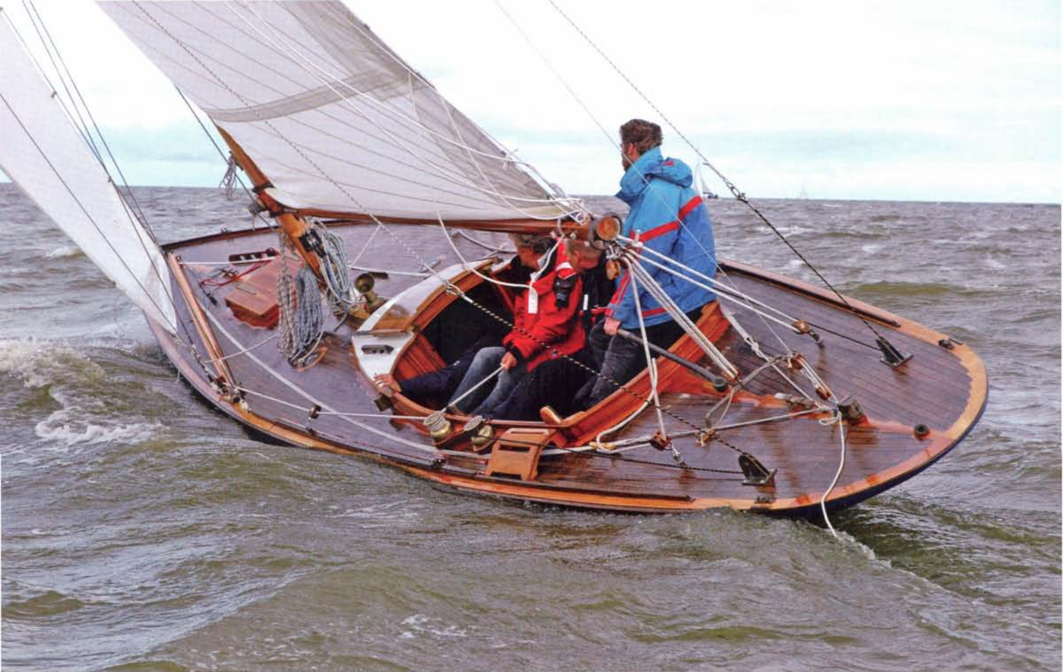
VKSJ-schip Blue Bird uit 1910 in haar element.

herbergde genoeg materiaal en daardoor kon het boek nog in het voorjaar verschijnen. Het werd een doorslaand succes, want in een maand tijd werden er 50.000 exemplaren verkocht. Nog steeds heeft Theo wekelijks contact met Wim de Bruijn. Samen hebben ze zo'n 200 boeken gemaakt. 'Het geheim van ons succes was, als je het achteraf bekijkt, dat we het allebei zo leuk vonden om het water op te gaan. We gingen allerlei dingen verzinnen om maar te kunnen varen. Ik denk dat ik wel voor 80 of 90 procent van alle werven in Nederland heb gewerkt. En ik heb wel 25 jaar lang alle