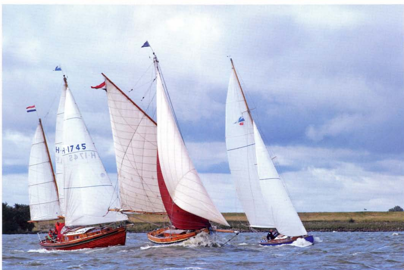
Stevige wind tijdens een VKSJ-wedstrijd.

vrijwel onmogelijk, dus er ging regelmatig wat mis met de apparatuur, zeker in zout water.