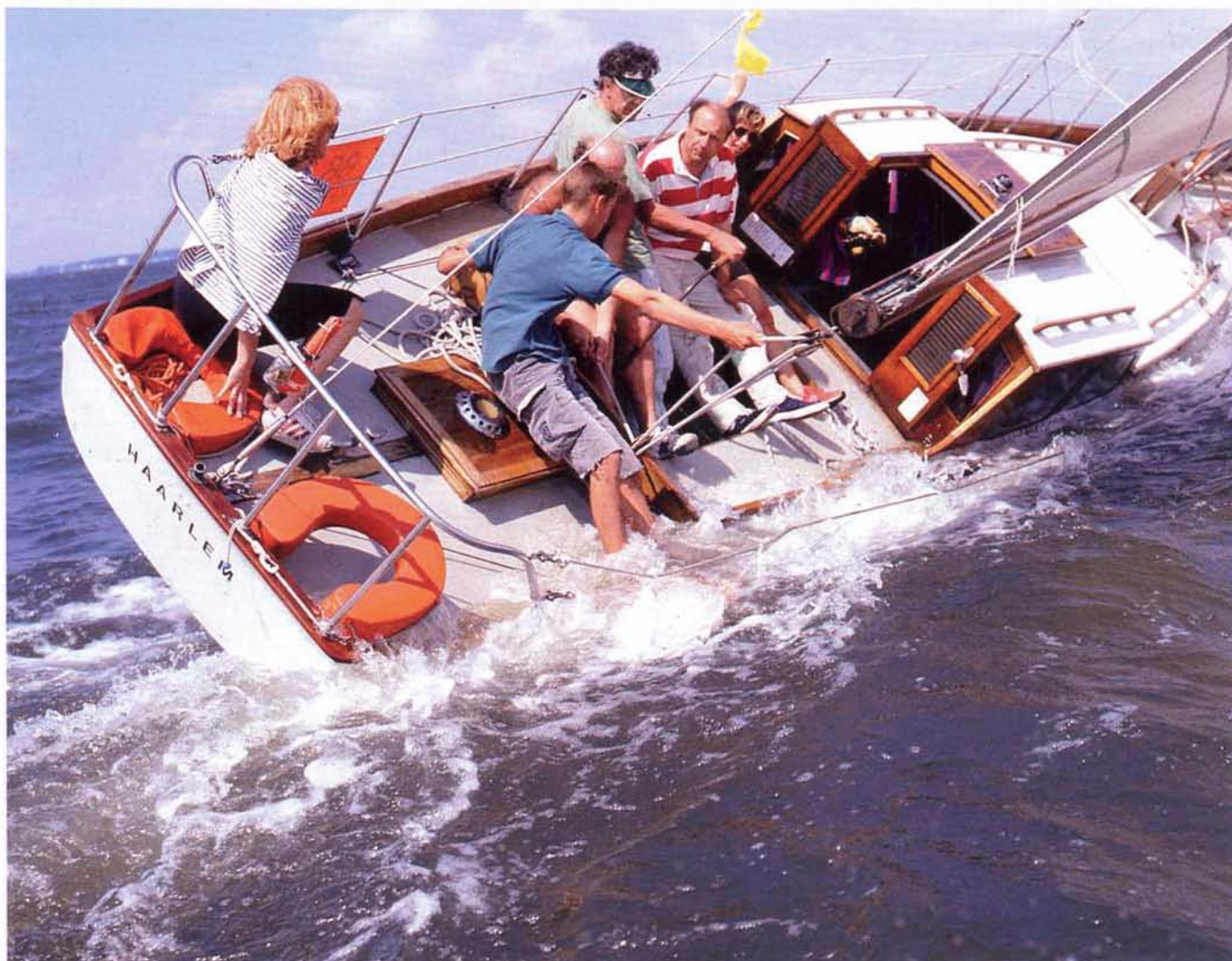
Het schip van de Haarlemmer scheepsbouwer Piet van Opzeeland.