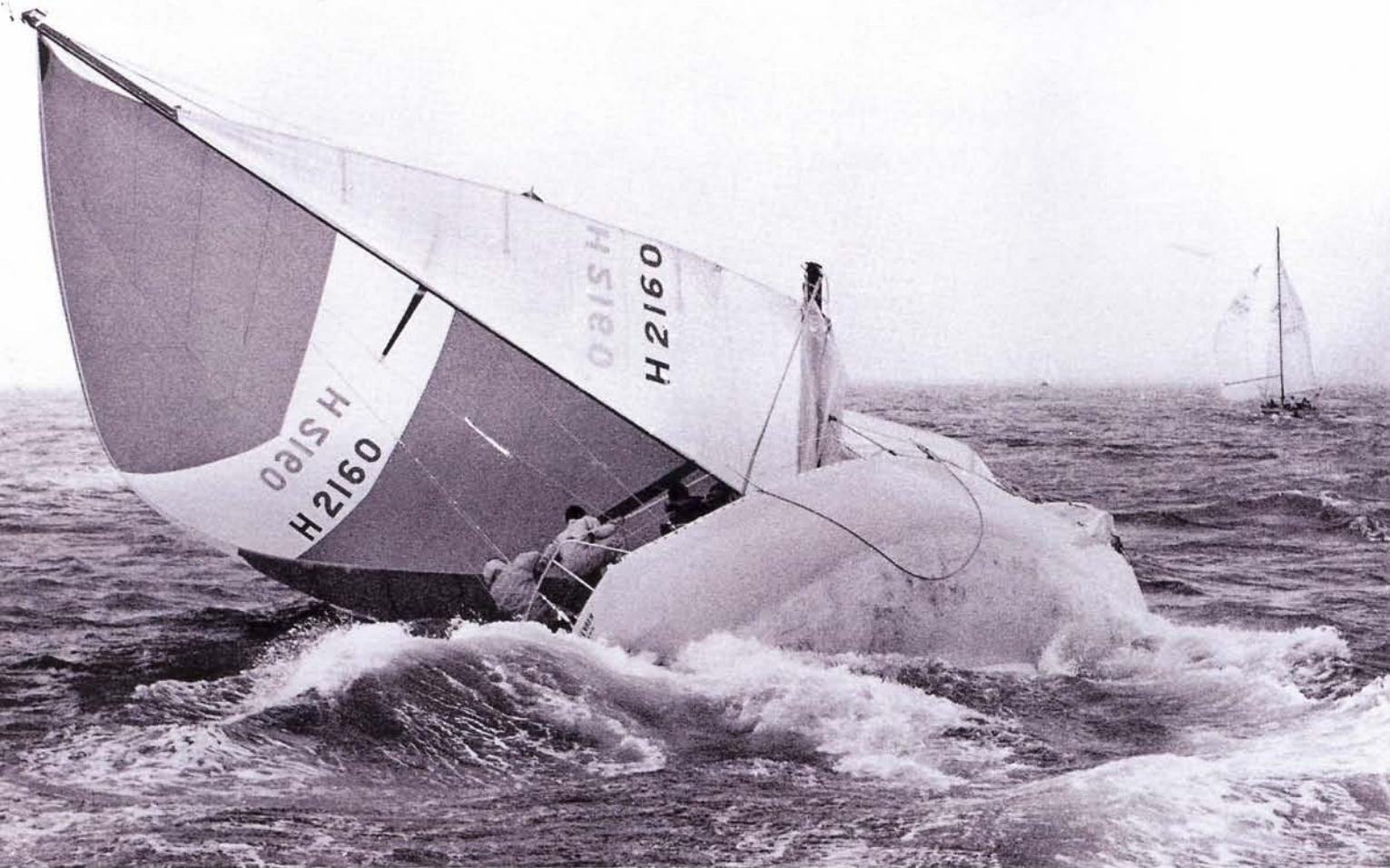
Regelmatig voer Theo Kampa uit met stormweer, om het opspattende water, de hoge golven en het hellende schip zo dynamisch mogelijk vast te leggen.