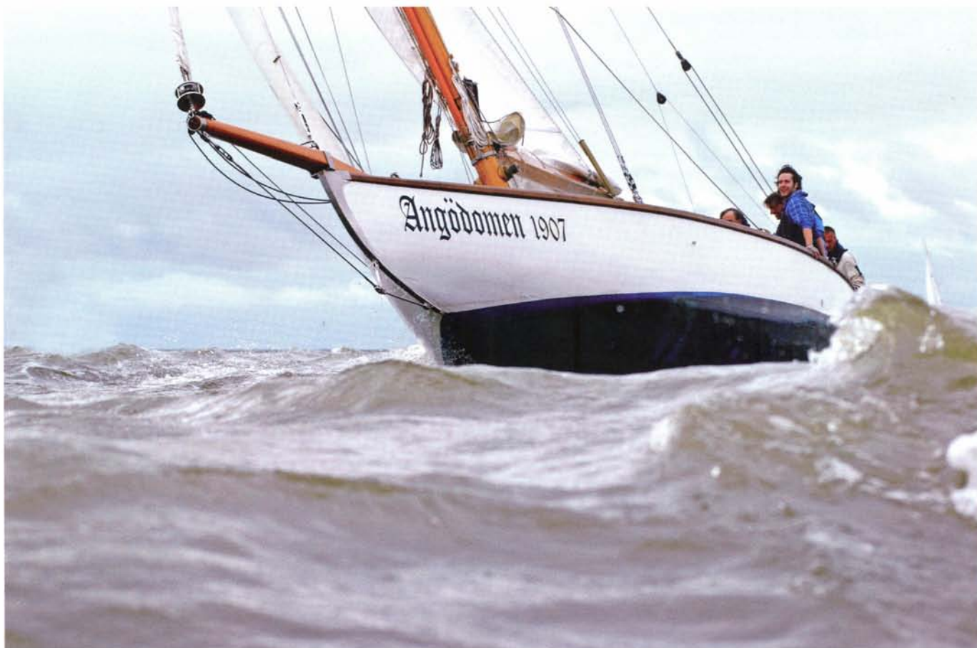
De Angödomen uit 1907 tijdens een VKSJ-wedstrijd op het IJsselmeer.

Iedere watersportliefhebber is – bewust of onbewust – vertrouwd met de foto's van Theo Kampa. Decennialang sierden zijn scheepsportretten de omslagen van tal van maritieme tijdschriften over de hele wereld. Met veel vakmanschap wist hij duizenden schepen op hun fraaist vast te leggen, ook schepen van de VKSJ.