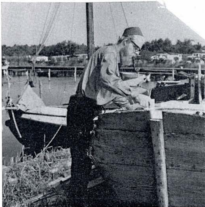
Aandacht voor het karwei.

N OG niet zo lang geleden voer op de Wijde Ee een oude schuit, die een poosje ruim liep zonder iemand aan het roer. „Werk van een oude vakman”, dacht ik; de schipper had zeker even iets anders te doen en dacht ouderwets, dat de anderen wel even zouden uitwijken. Maar niks, geen drie minuten later priemt hem een huurboot in de midscheeps. Komt me de verloren stuurman aan dek rennen, een hoogbejaard man met een spierwitte golfbaard, die de boosdoener gladweg de huid begint vol te schelden: „Lelijke ouwe Sinterklaas; kan je niet uitkijken, lelijke ouwe Sinterklaas!!”