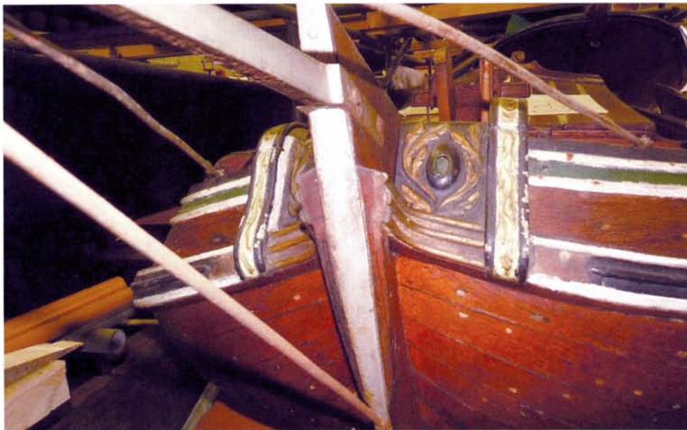
onder: Fraai Jouster steekwerk op de kluisborden en de beretanden