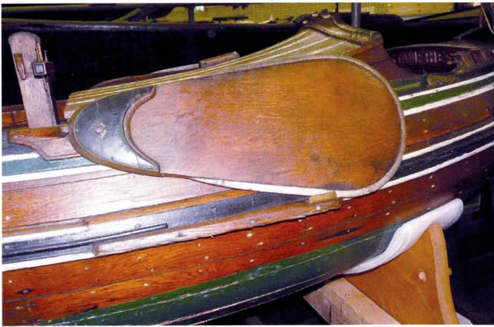
boven: De mooie tussenvorm van het zwaard