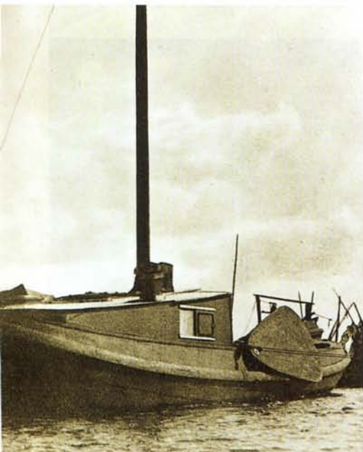
de visserij in de Graft en op het Prinses Margrietkanaal.