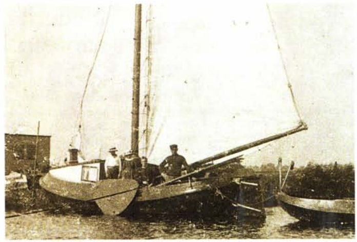
Visaak 'De Twee Gezusters' uit Joure. De opname stamt uit 1915 en is gemaakt op De Geeuw/Kruiswater.

In de kuip bevonden zich aan weerszijden banken met opberg-ruimte en in het midden de bun.