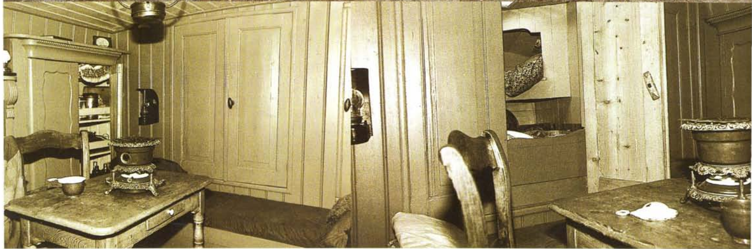
SPIEGEL DER ZEEVOGELT 1900/01