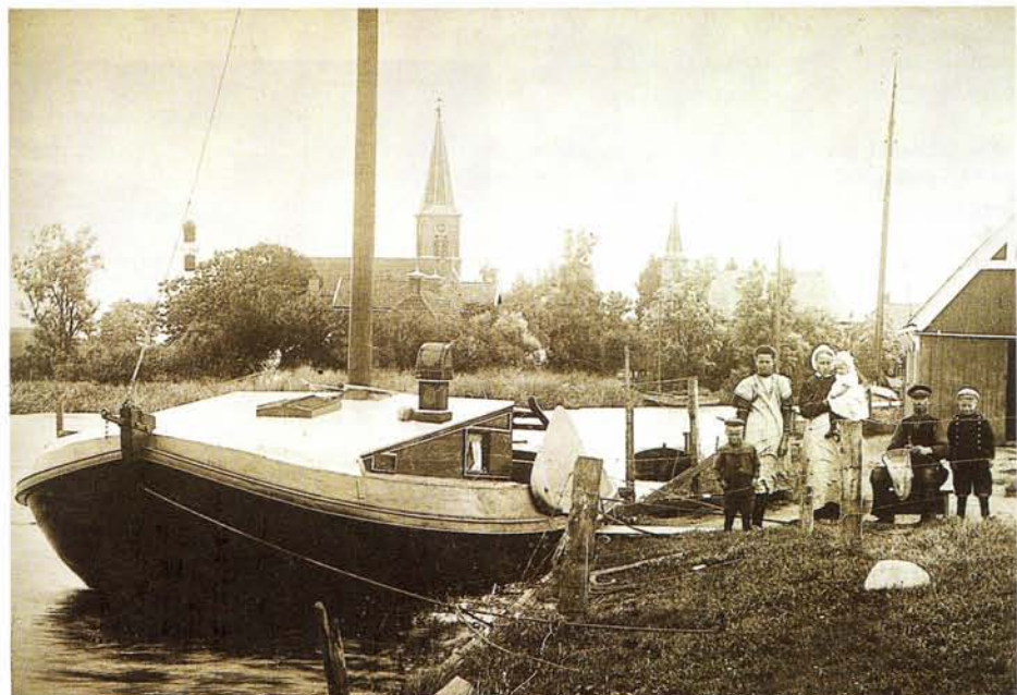
De familie van der Veen uit Oosthem bij een visaak.