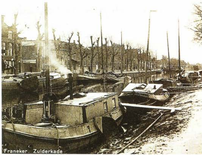
Franeker - Zuiderkade

Een visaja ke aan de Zuiderkade in Franeker. Ca. 1930.