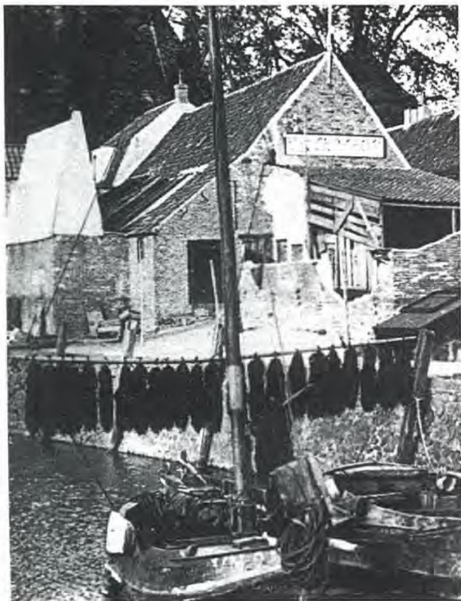
De VN 21, een Huisman-bol van 1916.