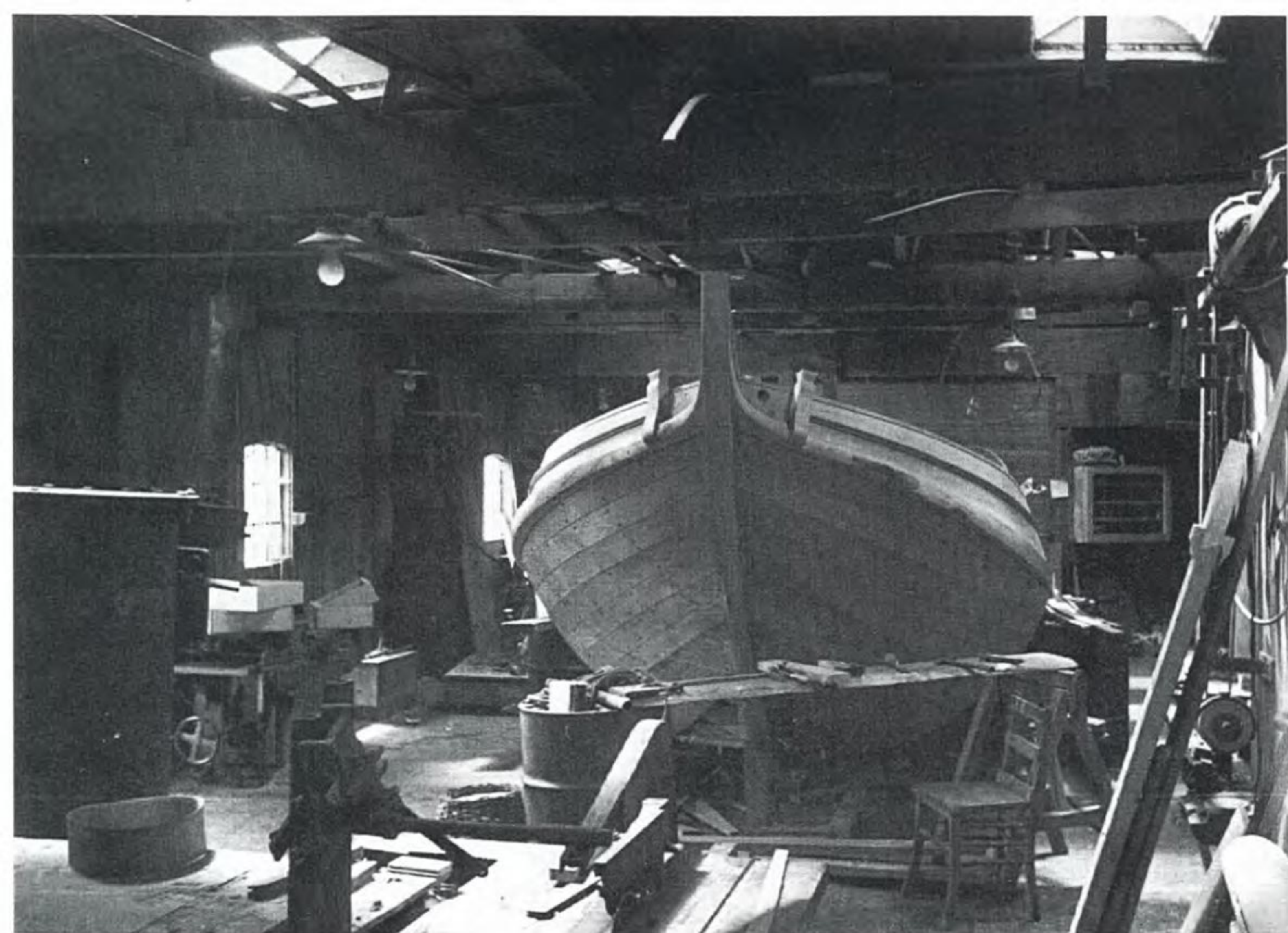
In deze loods aan de Ronduite zagen heel wat bollen het levenslicht.