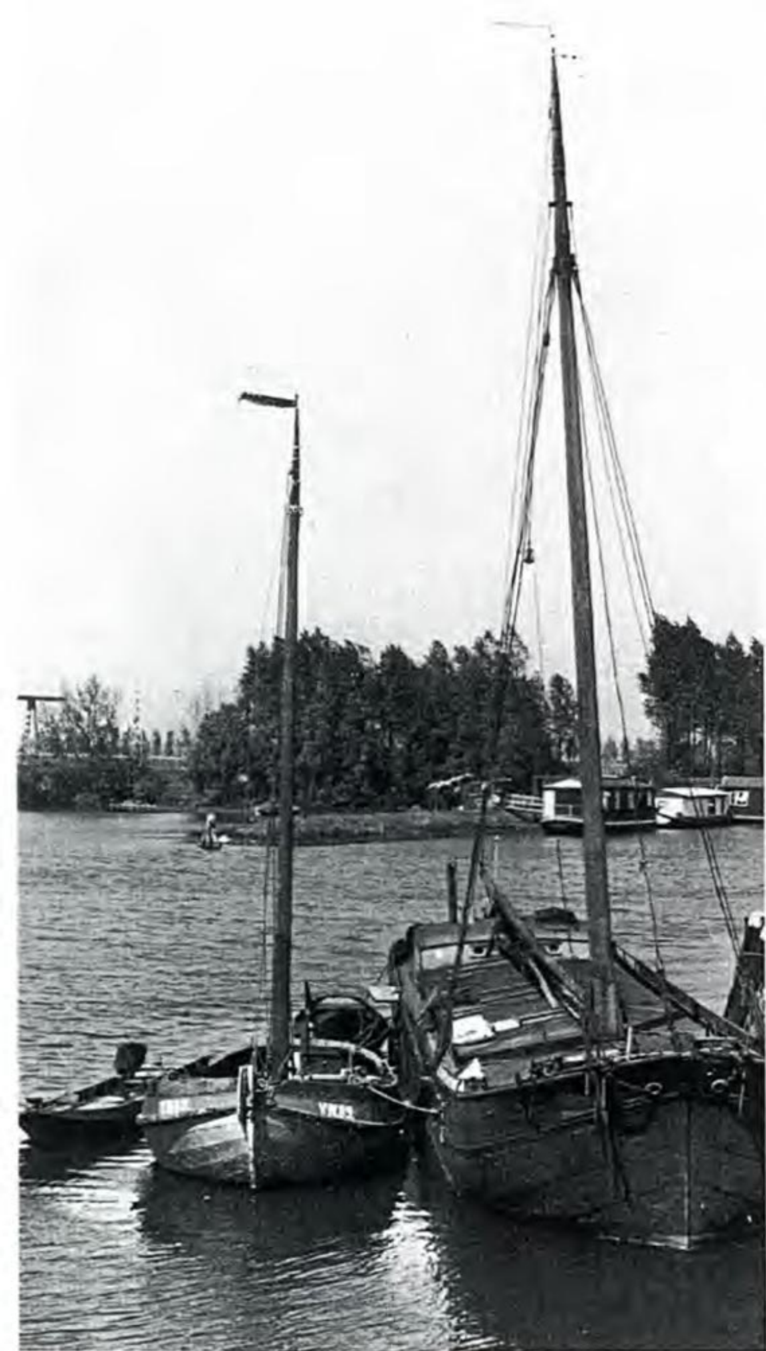
De VN 96 van Lute Kroes nummerde later VN 89.