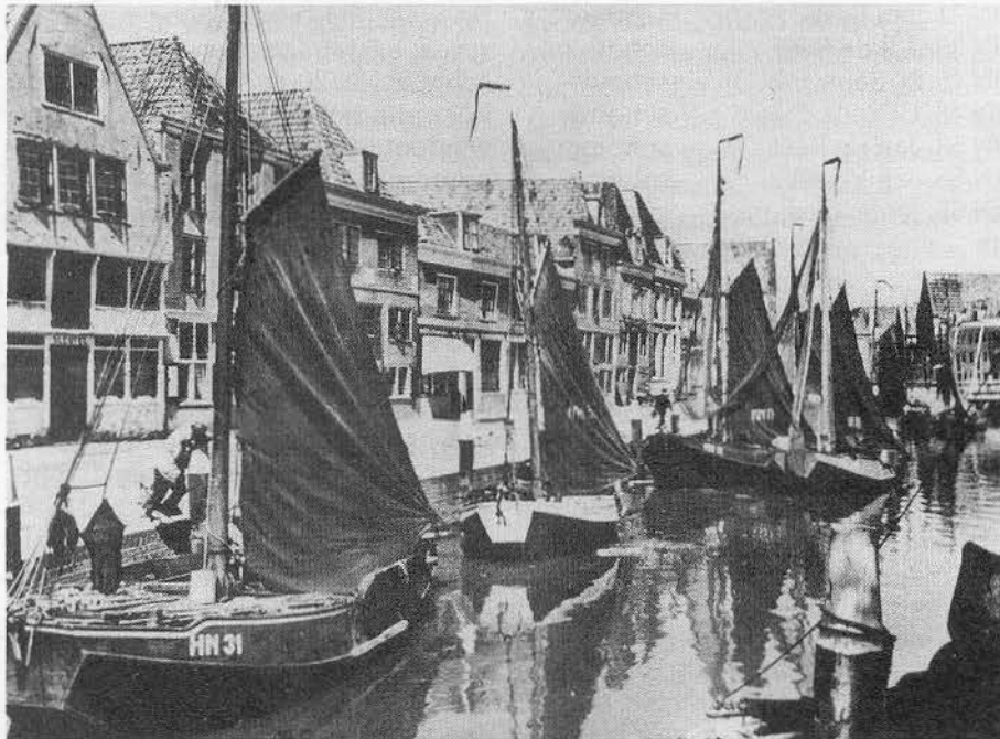
De spekbakkenvloot aan de Veermanskade in de jaren '20, een rijk gezicht.