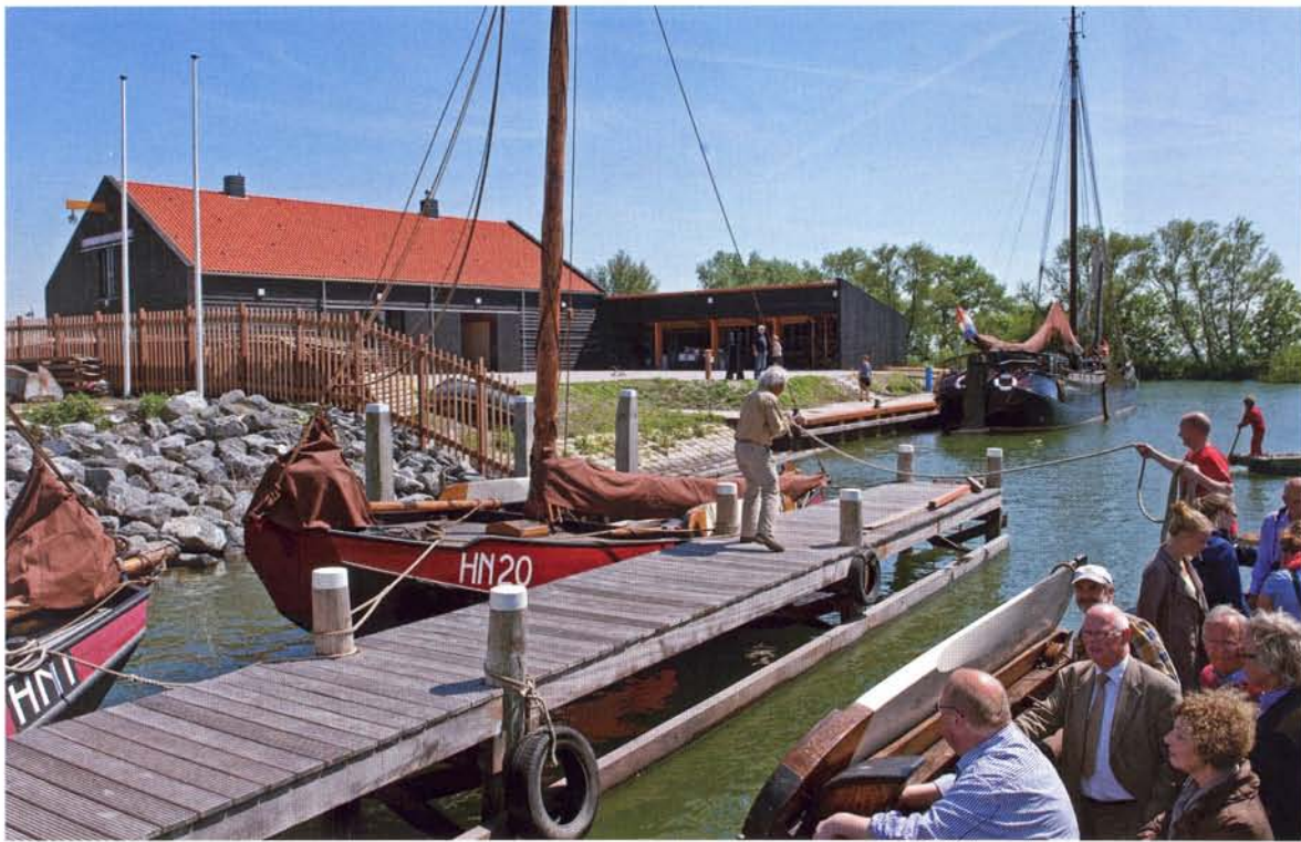
Een botter legt aan, op de achtergrond het gloednieuwe gebouw.