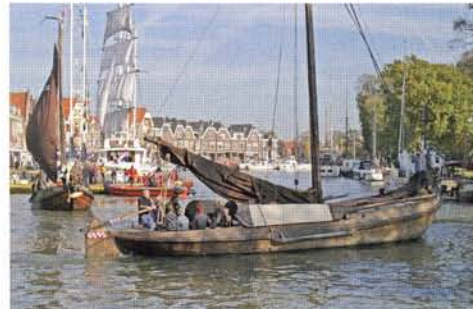
Botters in Hoorn varen regelmatig met gasten.