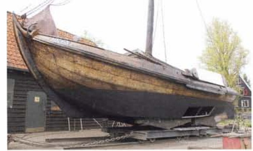
Een botter op de helling in Hoorn.