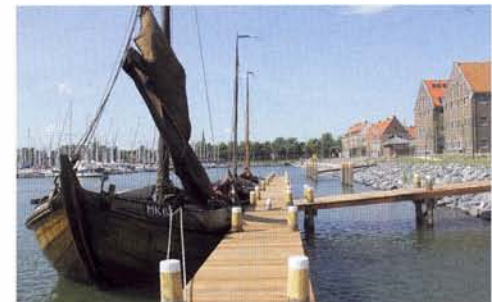
De nieuwe aanlegsteiger.

Er is geen twijfel mogelijk, de mannen en vrouwen in Hoorn zijn er in geslaagd om een aantrekkelijk centrum te maken op een fraaie plek. Ze hebben bewezen over een lange adem en doorzettingsvermogen te beschikken. Alles wat er te bewonderen is bewijst deze stelling. Ga er eens maar eens kijken.