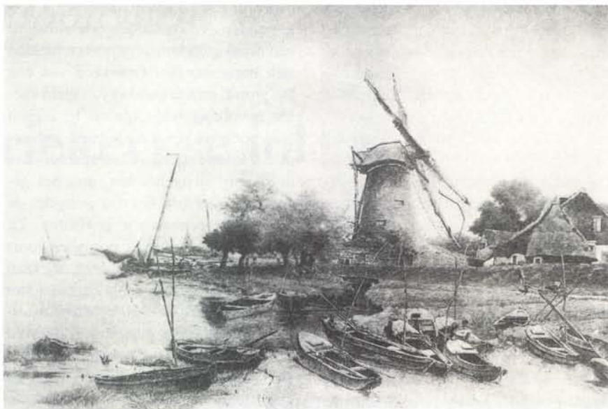
Foto van een schilderij van J. Meyers. De nu verdwenen witte molen te Mariekerke met op de voorgrond visboten van verschillende typen in de kil.

de jaren zeventig, toen belangstellenden hem kwamen ondervragen over zijn vroeger bedrijf. Enkele botenbouwers reageerden op dezelfde manier. Hetgeen maar weer aantoonde dat een naam niet altijd de lading dekt. Om hem echter van andere visboten te onderscheiden en omdat hij nu toch algemeen onder die naam bekend staat zullen we hem zo maar blijven noemen.