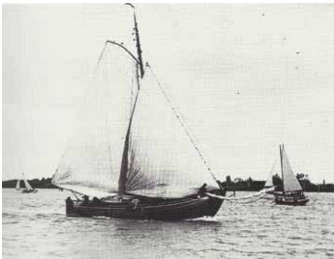
De 'Clémence' zeilend op de Schelde bij Antwerpen. Bron: 'de botter' Jules Van Beylen