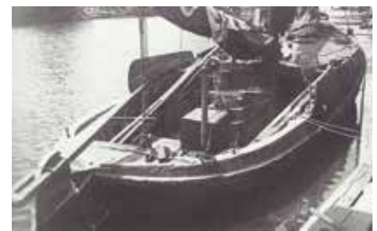
Visbotter (met alleen een voordek, lengte 11 tot 13 meter)

paragraaf van zijn boek aan de Noordzeebotter, enorme brede en lompe vissersschepen met een middendek en geen kajuit, zodat het hardnekkige verhaal dat de Nixe 2 een Noordzeebotter is, naar het rijk der fabelen kan worden verwezen. Ook heeft de Nixe 2 , zoals wel wordt verteld, niet als loodsbotter op de Schelde gevaren.