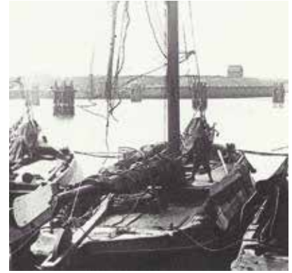
Noordzeebotter (met middendek, lengte circa 17 meter)