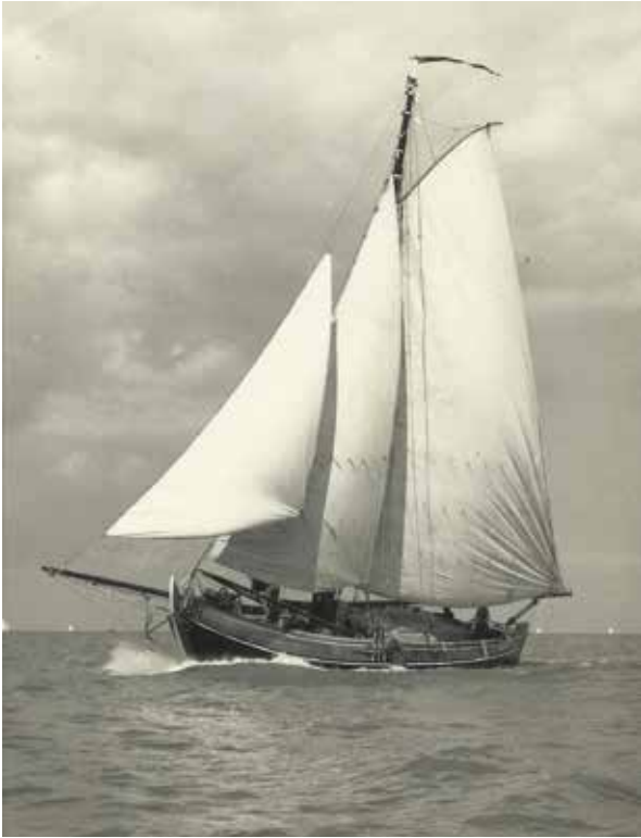
De 'Brontoliet' (ex-'Brederode'; ex-'Nixe'; ex-'Nixe 2') in 1961 tijdens de Zeelandwedstrijden van Rotterdamse KR&ZV 'de Maas'.

vissersschip (Weesp, Unieboek b.v. (De Boer Maritiem), 1985), dat voornamelijk over de bekende visbotters van de Zuiderzee gaat, besteedt Jules Van Beylen een apart hoofdstuk aan botterjachten en hij legt uitgebreid het verschil uit tussen deze jachten en de visbotters. Van Beylen wijst erop dat de lijnen van de zeer grote botterjachten sterk afwijken van die van de echte visbotter. De botterjachten kregen een hoger achterschip dan de visbotters omdat bij een