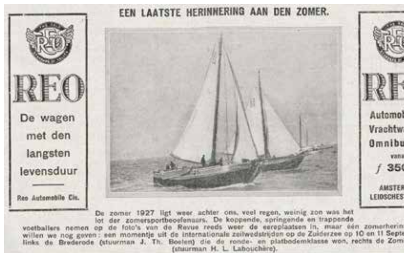
Twee Belgische botterjachten strijdend op de Zuiderzee.