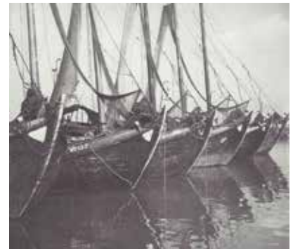
Visbotters (met hoge voorsteven)