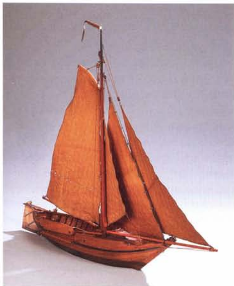
Model van een pluut in het Zuiderzeemuseum

Zwarte Water, de Ketel en natuurlijk dat prachtige Ganzendiep waren hun favoriete vaarwateren. Door acute leukemie was Willem echter niet meer in staat het schip naar behoren te onderhouden en het regelmatig te hozen. De pluut gaat achteruit en Regien en hij besluiten in 1973 om het schip te verkopen.