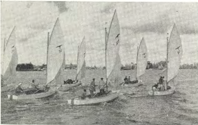
Beelden van de Goudse Zeilweek 1949

van het Centraal station gломmen van het spattende regenwater. Voor de Oranjesluizen voeren we wat heen en weer, aangezien ik een grondige afkeer heb van een lege sluis, draalden we met binnenvallen. Daar echter