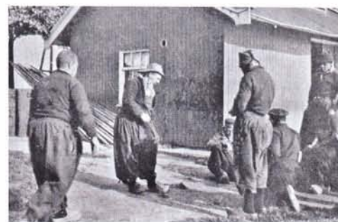
Vissers bij het kleine gebouwtje van de visafslag van Schokland dat toen al lang onbewoond was

Vanaf nu wordt hier regelmatig vergaderd. Soms zijn de discussies heftig. Over en weer verwijten de leden elkaar alleen op te komen voor hun eigen belang - het spreekt voor zich dat de ingesleten gewoonten niet eenvoudig te veranderen zijn. Naast dat de raad bepalingen afkondigt waaraan de vissers zich dienen te houden, zoals de maaswijdten van de netten, probeert zij in de wintermaanden door voorlichting in de vissersplaatsen de vissers te overtuigen van de noodzaak visafslagen te openen. Zo kunnen de vissers onder de