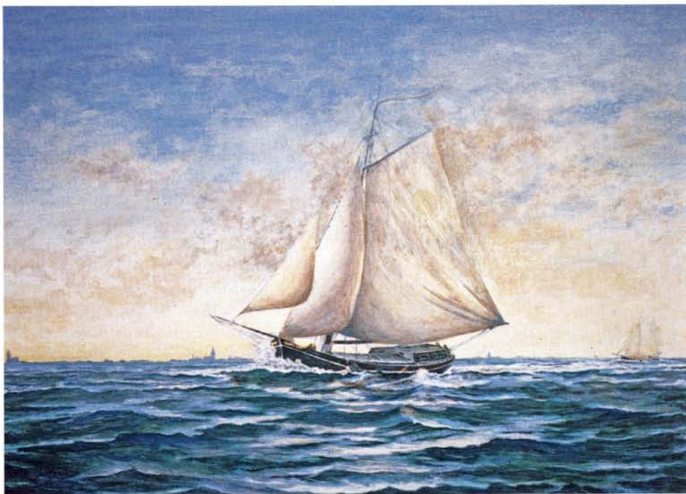
boven: Een klipper onderweg op de Zuiderzee, soms staken er 100 schepen per dag over

Van alles werd er bedacht om de omzet van de afslag te verbeteren. Natuurlijk moesten er op de eerste plaats vissers zijn die vis aanbieden, maar ook moeten er opkopers zijn die willen kopen. Indien nu de directeur van de afslag voor eigen rekening mocht kopen dan zouden de vissers minder afhankelijk zijn van de kopers, zo dacht men. Ook kwam er een rode