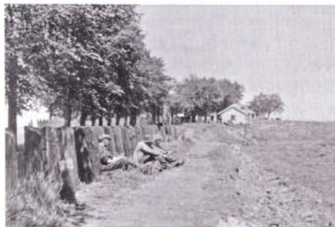
links: Beeld van het oude Emmeloord

vlag als er opkopers waren zodat iedere visser van ver af kon zien dat er gehandeld werd. Eigenlijk blijft het beeld van grote verschillen gedurende de gehele periode dat de afslag heeft gedraaid, bestaan.