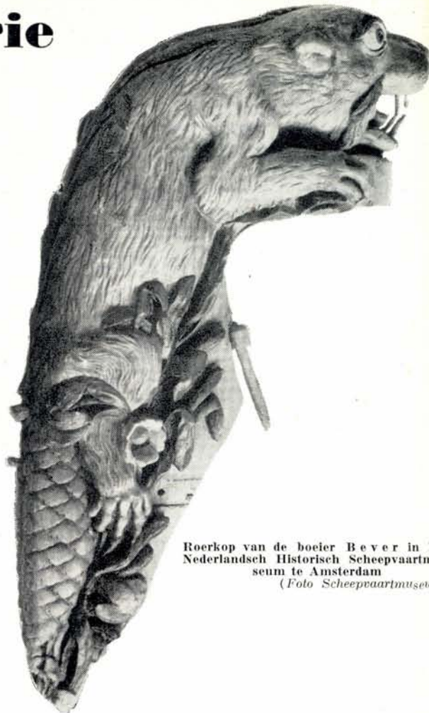
Roerkop van de boeier Bever in het Nederlandsch Historisch Scheepvaartmuseum te Amsterdam