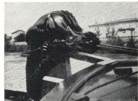
Draak op het roer van het Lemsteraakjacht Maria

genoeg identiek is aan de voorgaande. Volgens de gegevens werd deze in 1929 aangekocht van iemand (onbekend wie), die beweerde dat het afkomstig was uit Zeeland.... Naar wat bekend is van de beide andere Bevers is dit echter twijfel- achtig.