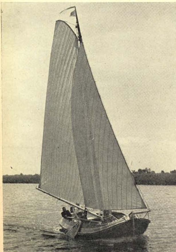
★ Fries jacht „Frisia”, gebouwd in 1876 door E. H. van der Zee, Eigenaar de heer R. Buisman te Zwartsluis.

1952 de nu 32-jarige boeier wordt .....filmster. Zij wordt nl. aangekocht door Metro Goldwyn Mayer en deelt de hoofdrol in de film „Never let me go”, met niemand