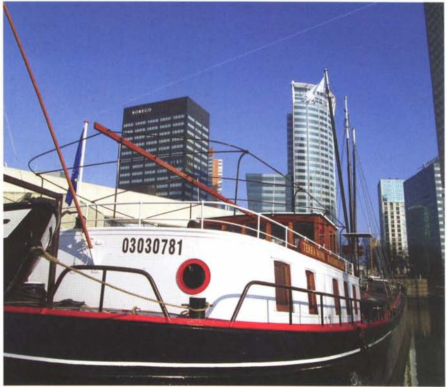
ENI van de Terra Nova, gekoppeld aan het brandmerk 781 B Leid 1929

Je hebt een woonschip gekocht met het brandmerk 3630 B Rott 1928. Het brandmerk bestaat nog bij het Kadaster maar inmiddels heeft het