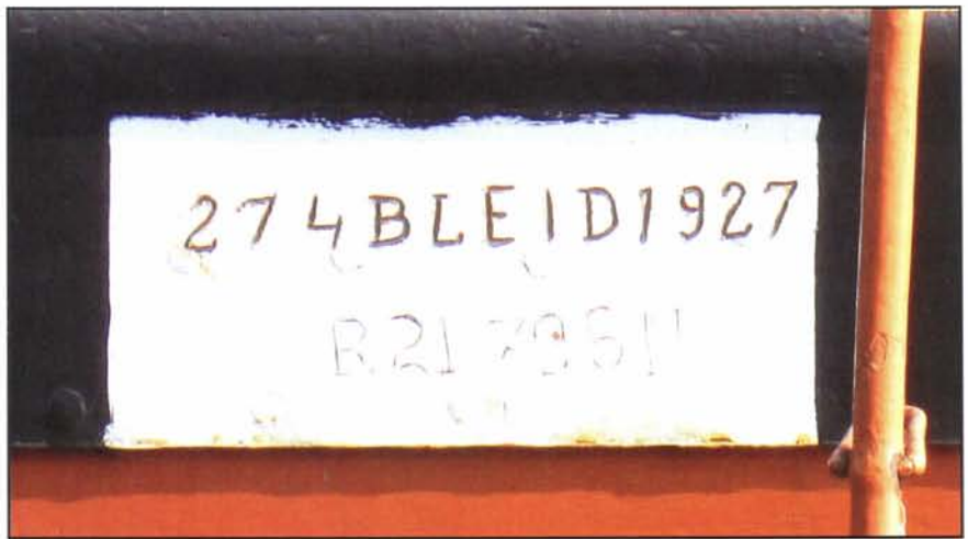
Ingehakt brandmerk en meetnummer