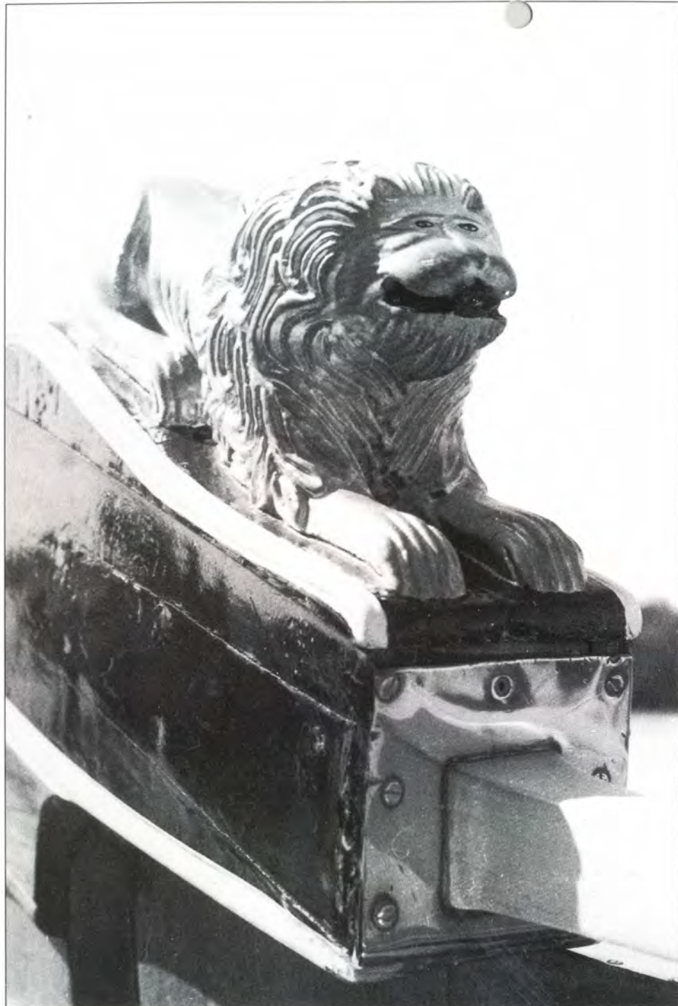
Leeuw op het roer