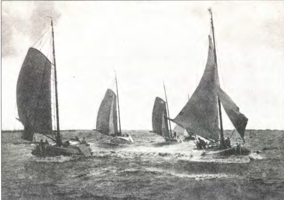
Boeiers op het Sneekermeer tijdens hardzeildag 1912.