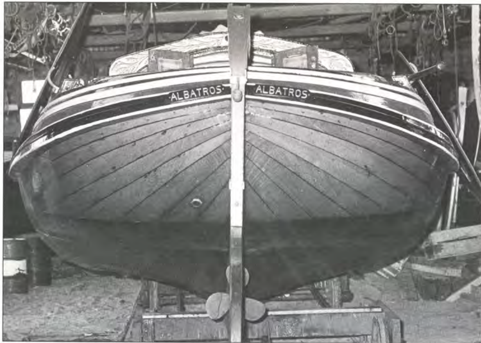
Achteraanzicht Albatros 1978