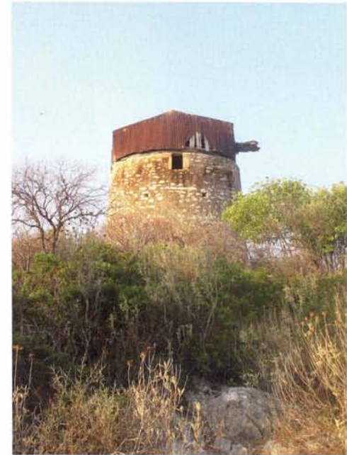
Ruïne olijfmolen op Kastos.

Op het kleine eiland Kastos is het haventje vol en we meren aflangszij een rondvaartboot die verbouwd wordt en voorlopig niet in de vaart zal zijn. Een paar stevige Grieken leg-