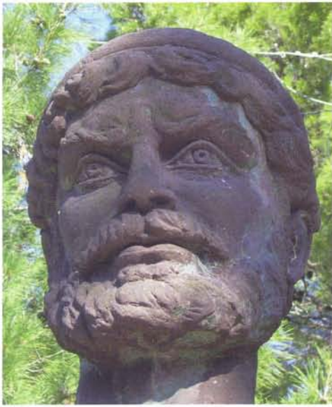
Standbeeld van Odysseus bij de Polo baai.