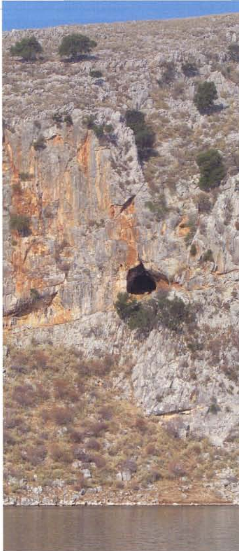
Grot in Petalas.

Tussen Zákynthos en Kefalonia zorgt de deining uit het noordwesten voor een erg onrustige zee. Op de motor, met de zeilen gehezen als steunzeil, komen we na een overtocht van 8 uur aan in de grote haven Zákynthos. Ik zoek altijd eerst naar een plekje tussen de vissersschepen voordat ik me tussen de jachten in een jachthaven moet wurmen. Ook dit keer zijn de vissers uitermate behulpzaam en helpen bij het aanleggen op de lege plek van een vissersboot die enige dagen weg zal blijven. We staan net op het punt een ouzo in te schenken als de Port Police met vier man sterk komt vertellen dat we naar de jachthaven moeten. Het lijkt Terschelling wel. Als ik uitleg dat mijn aangehangen roer problemen geeft als ik met de kont naar de kade moet aanleggen, mag ik langs zij op de plek van een veerboot, als ik de volgende dag voor 15.00 uur ben vertrokken. Meteen verschijnt er een man op een motorfiets die ons Private Pleasure Maritime Traffic Document wil zien (een document dat officieel iedere boot moet kopen voor € 30,- en dat in iedere haven afgestempeld dient te worden - red.) en € 30,- liggeld. Er zijn geen faciliteiten, maar ik krijg wel een WiFi-wachtwoord. 's Avonds ligt het door de