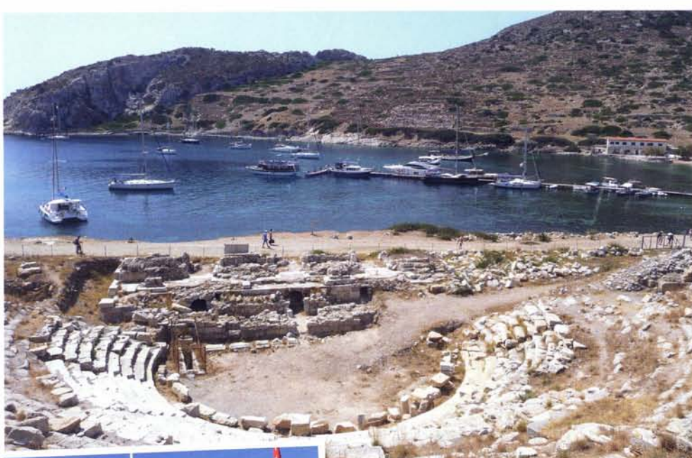
boven: Alcedo in de haven van Knidos, met op de voorgrond Oudgriekse ruïnes