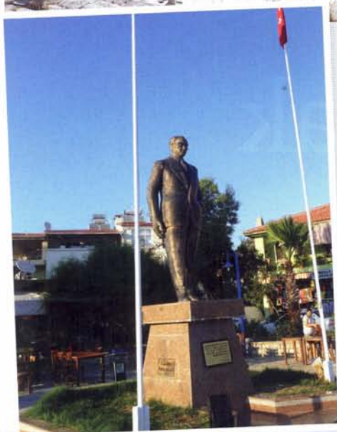
midden: Net als in elk Turks dorp en stadje staat ook in Datça een groot standbeeld van Kemal Atatürk, de stichter van de Turkse republiek