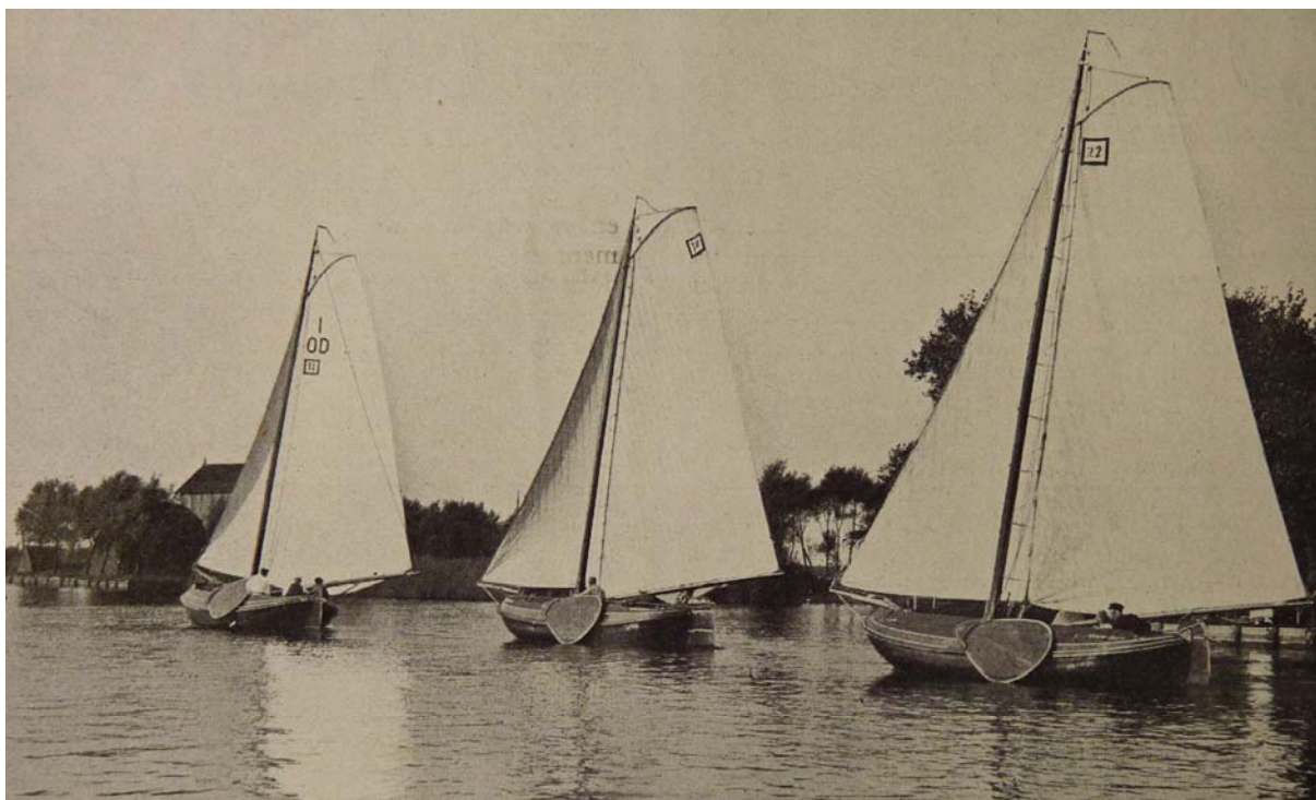
Foto uit “Ons Element” 1921 in Friesland. De Argo met zeilnummer 1 OD, midden Nut en Nocht, rechts Frisia.