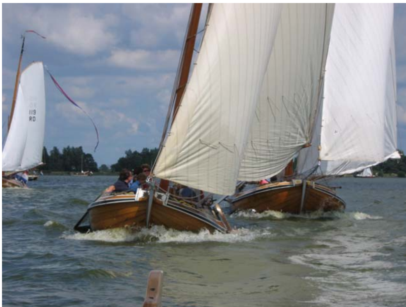
Op de voorgrond de Froukje (gebouwd door Visser in 1911) gevolgd door haar voorbeeld Argo. foto Robin van Son 2006.

De eigenaarsrelatie van de heer Jongejan met het schip is blijkbaar veel korter geweest dan eerder verondersteld. Was de heer Jongejan een huurder die er in Friesland er wedstrijden mee zeilde en haar dan inschreef onder de naam Kikker III?, immers alle Paterswoldse jachten van Visser en Helder konden individueel gehuurd worden voor het zeilen van wedstrijden.