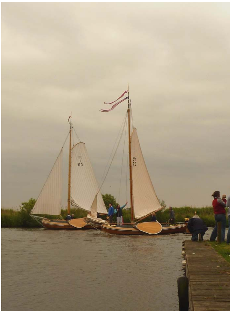
Foto GtC 28 mei 2011. De Argo 1 OD en de Froukje 85 RD tijdens de bijeenkomst op de Tjonger ter gelegenheid van 100 jaar Froukje.

verhaal vond tot ieders verbazing z'n bevestiging in de winter van 1981/82. Toen werden in Grouw door Albert Wester een tweetal boegen vervangen van de stevenbalk tot onder de mastbalk. Dat bleek namelijk nodig omdat de naad tussen de twee gangen met geen mogelijkheid dicht te krijgen was vanwege ..... paddestoelen!"