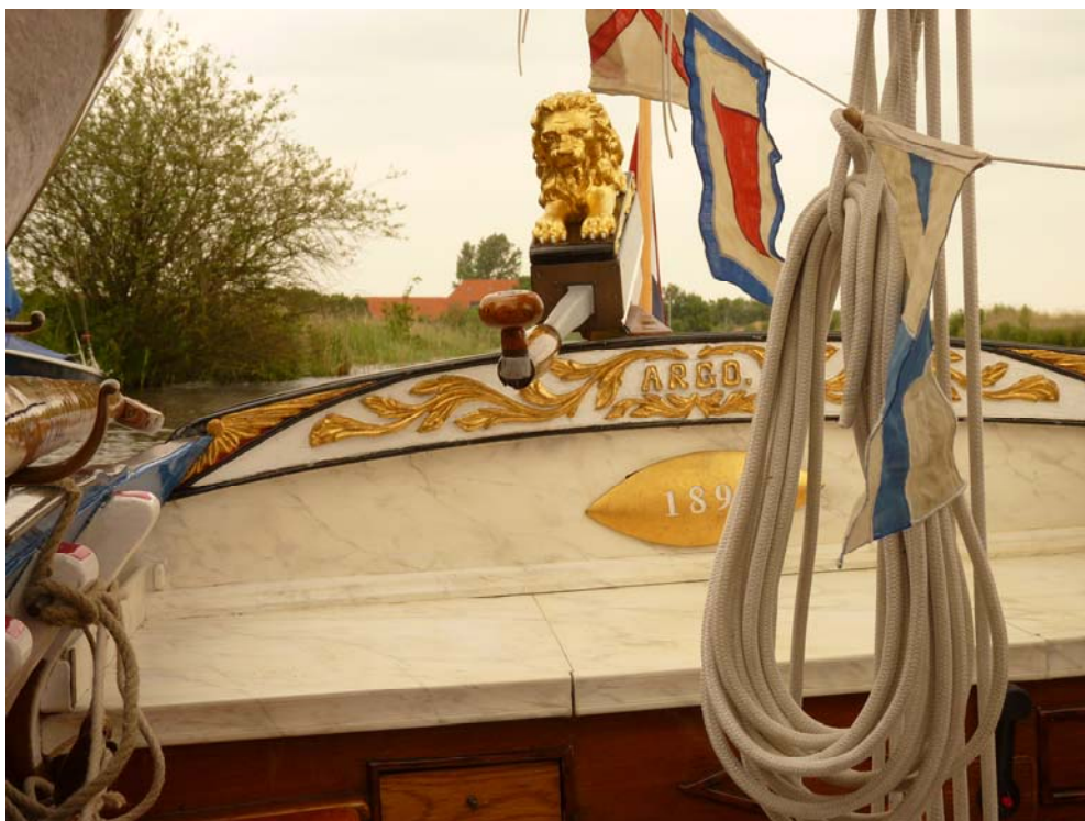
Gemarmerde achterbank van de Argo.