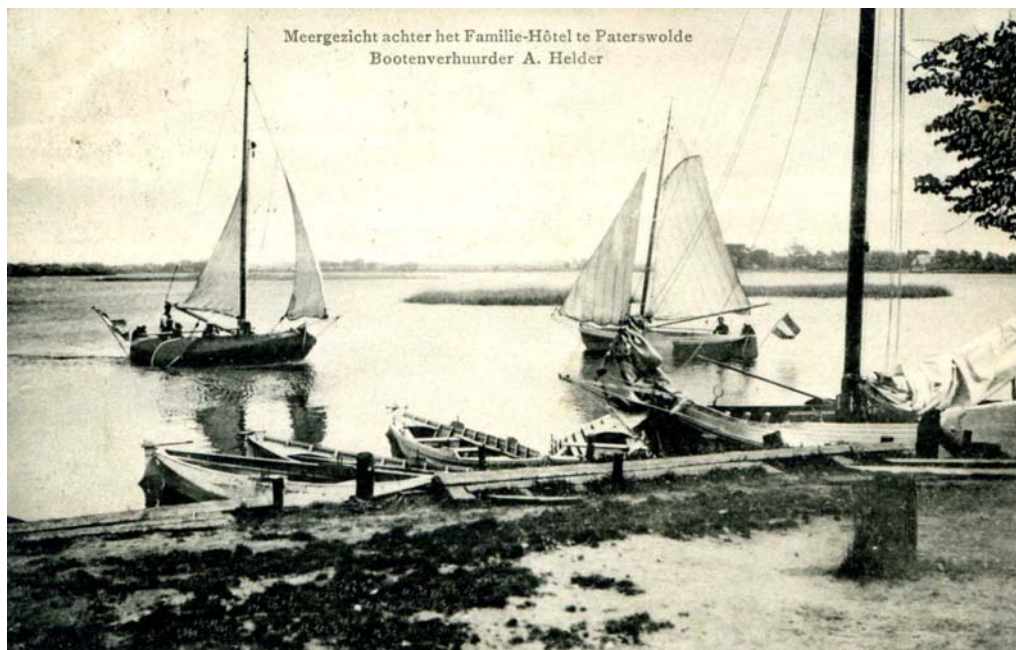
(scan anicht GTC) Foto Kramer 1915.

Er zijn een tweetal ansichtkaarten met de Maria en de Poseidon zeilend en de Vliegende Hollander tegen de wal liggend achter het Familiehôtel. De originele foto ervan is gemaakt in 1915 door foto Kramer uit Groningen.