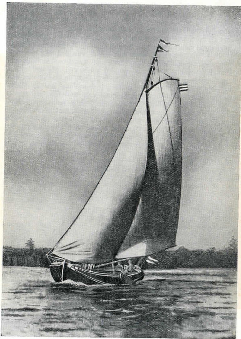
Met het historische zeiljacht „Argo” op 't wijde Friesche water