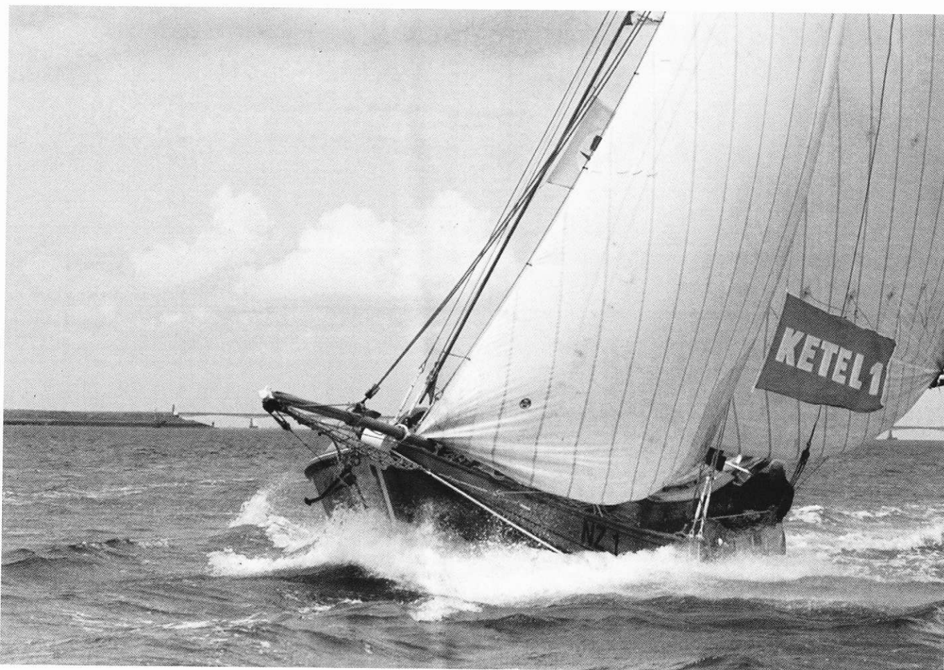
De Banjaard (NZ 1) op de Van Loon hardzeildagen in 2005.