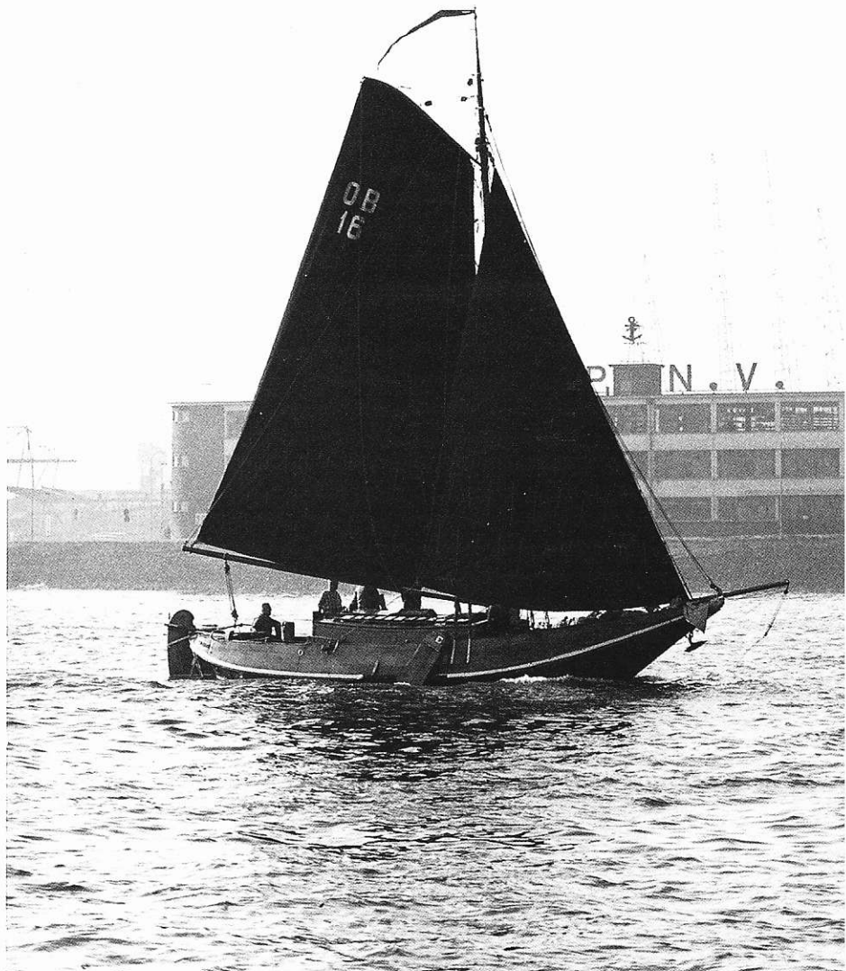
De Banjaard (NZ 1) op de Nieuwe Waterweg in 1961.

Het oude vlak was vastgezet met houten pennen, waarbij later extra pennen zijn aangebracht die wat groter van formaat zijn. Verder viel het Peter Schouten op dat de kimmen langs het vlak lopen zoals bij schouwen gebruikelijk is. Ook kwam er een stalen T-profiel van ca 60 cm tevoorschijn ter hoogte van het kussen. Wat de functie daarvan was, is niet duidelijk, ook Melis