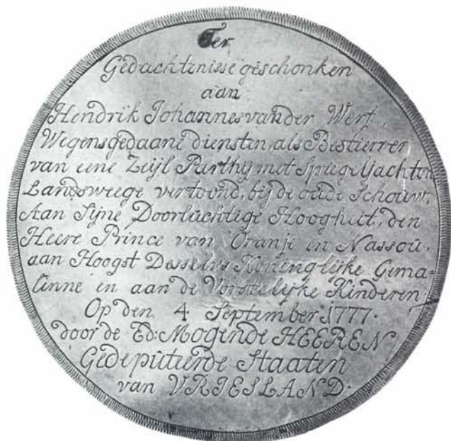
Penning betreffende de vorstelijke hardzeilpartij op 4 september 1777 bij de Oude Schouw, aanwezig in het Fries Museum te Leeuwarden.