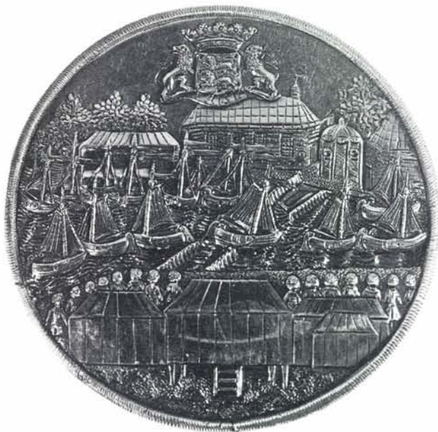
De keerzijde van de penning, waarop sprake is van een wedstrijd van spiegeljachten.

In het verband van een relaas over het „Oranje hardzeilen” op 4 september 1777 bij Oude Schouw, tussen Leeuwarden en Akkrum, schreef Halbertsma, zonder overigens met bewijsmateriaal te komen: „Maar ook het schip zelf, mirabile dictu, bestaat nog altijd, zij het in danig onderkomen vorm omdat de tijd aan de inhouten knaagde en een brand de roef met een deel van het dek vernielde. De romp ligt in ieder geval nog te Broek in Waterland als een met zorg bewaarde relik, toebehorende aan de