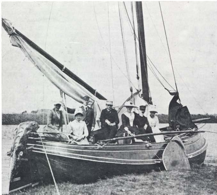
De leden van de families Pijterssen en Wouda aan boord van de Bever ca. 1890

Daarbij is het niet zo belangrijk, dat eerstgenoemde bouwer van het schip, Sjoerd Jouwes Stapert, als een warme Oranjevriend beschouwt en Wegener Sleswijk van mening is, dat Stapert een prominent patriot was, die in 1787 naar Frankrijk vluchtte en eerst na zijn terugkeer (mèt de Franssen) in 1795 als architect van 's Lands (dat is: Frieslands) Werken werd benoemd. Tenslotte kan Stapert tussen 1777 en 1787 best van mening of sympathie zijn veranderd.