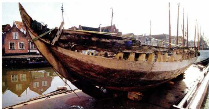
Het schip werd op een dekschuit vervoerd vanuit Emmeloord.