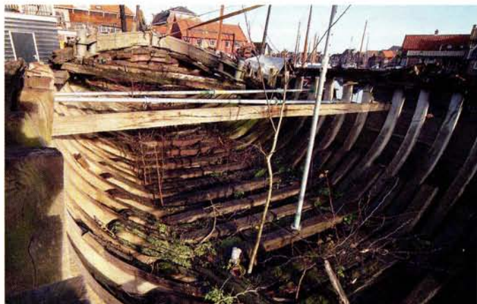
De bomen groeiden door de romp heen.