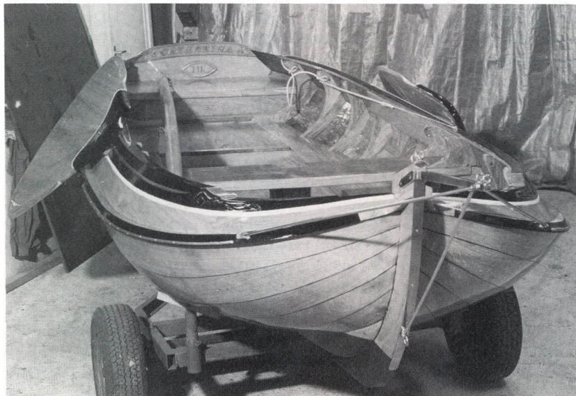
Let op de sterk gepiekte vorm in het gehele sloopje.