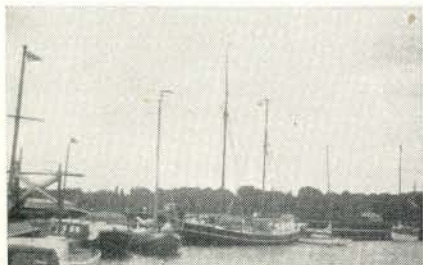
Rungsted aan de Sond

Woensdag 11 Augustus. Het heeft 's nachts weer hard geregend, maar het waait minder en we gaan uit met onge-reefd grootzeil, fok en kluiver, maar onder weg begint het weer te waaien, we reven en minderen zeil, maar hard gaat het toch. Af en toe een gietbui, zodat de zee vlak regent en dan weer wind er achter aan. Over bakboord aan lij zien we de wal van Funen met enige hoge kapen. Om half twee lopen we het vaarwater in tussen Funen en het eilandje Lyö en dan begint het pas goed te waaien. We strijken het grootzeil en lopen op de kleine fok voor de storm weg in de richting van de Svendborg Sund. Het regent niet meer, maar waait des te harder. Een groot zwaar jacht komt ons dichtgereefd tegemoet. De Svendborg Sund is een grote trechter, die met een flauwe bocht naar het oosten