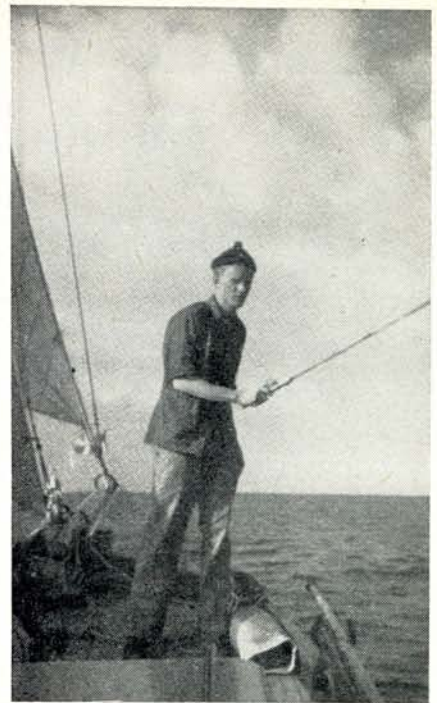
Vissen in de Grootte Belt

Zaterdag 7 Augustus. 's Nachts is er nog veel regen, maar 's morgens begint het alweer op te klaren. We nemen nog wat verse proviand in en een pakket accijns-vrije dranken en sigaretten en dan zeilen we voor een mooie zuidwester de Kieler Förde uit naar Labö. Daar komt