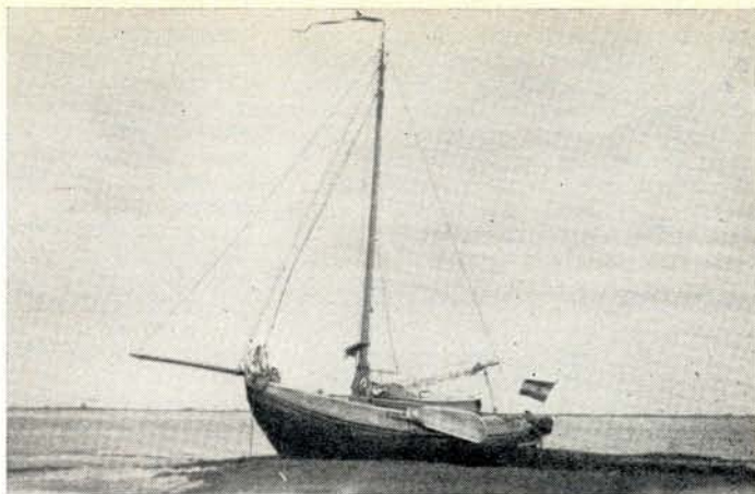
„De Vrouw Lucia”, drooggevallen op het Friese Wad bij Holwerd

Sedert 1930 bezit ik hetzelfde schip, een Vollenhovense Bol van ruim 8 bij 3 meter, met een diepgang zonder zwaard van 85 cm. Het scheepje is als jacht gebouwd aan de Ronduite en ik heb er mee gevaren op de Loosdrechtse plassen, de Zuiderzee, in Friesland en de Wadden. Ik heb er steeds meer vertrouwen in gekregen en ben er steeds meer van gaan houden. Lang had ik een wens: er eens mee naar Denemarken te gaan, om daar met eigen schip te zwerven tussen al die eilanden. Telkens als ik vloog naar of van Kopenhagen en het helder genoeg was om te zien, had ik neergekeken naar dat prachtige vaarwater en telkens werd die wens versterkt. In de zomer van 1954 deed zich dan de gelegenheid voor die wens ten uitvoer te brengen. Vaak is het zo, dat wanneer een langgekoesterde wens in vervulling gaat, het toch niet zo is als men zich had voorgesteld, er is een zekere teleurstelling, dat het toch niet zo was als men zich had gedacht. En als het voorbij is, is er een zekere leegte. Het tegendeel is waar geweest: het water en de kusten zijn daar zo mooi, dat ik er graag weer heen zou willen om verder te ontdekken en te genieten en de herinnering aan de gemaakte tocht is rijk.