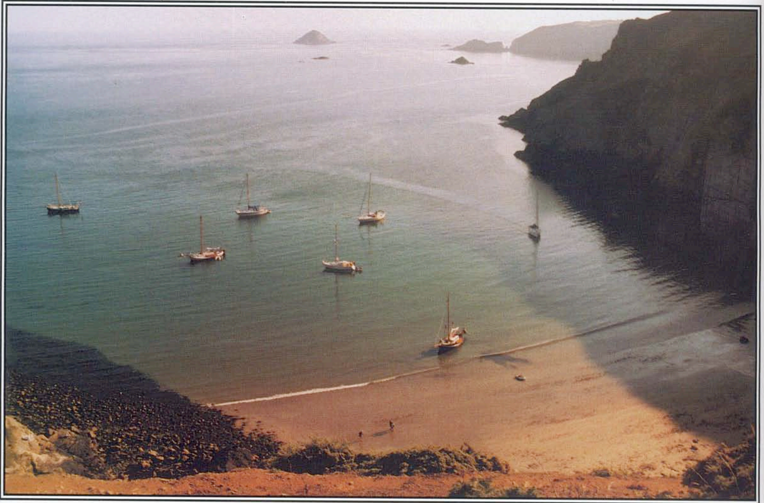
Derrible Bay op Sark is een prachtige plek. Helder water, kleine stranden begrensd door hoge rotsen. De Zwarte Buffel komt het dichtst bij het strand...

niet stranden. Dan zien we plotseling een kajuitjacht dat zich losmaakt van de kust. Het komt rechtstreeks uit de baai! Door de verrekijker zien we dat hij vrij rustig kan varen, zonder stampende bewegingen. Het is het geen groot jacht, maar wie steekt er minder dan onze 80 cm? Met zweet in de handen neem ik de helmstok over van de stuurauto-maat. Ciska neemt nogmaals de beschrijving in de pilot door. "162 graden aanhouden, skip, naar de groene staak bij de ingang en let op de dwarsstroom van 2,5 knoop." Temidden van wit schuim zie ik een puntje rots aan stuurboord. Zijn we ook vrij van de andere rotsen? De staak aan stuurboord laten, repeteer ik, we zijn er bijna. De golven