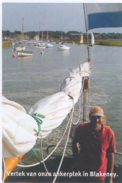
Vertek van onze ankerplek in Blakeney.

NORTH NORFOLK, EEN ONTDEKKING, VOOR WIE KAN DROOGVALLEN