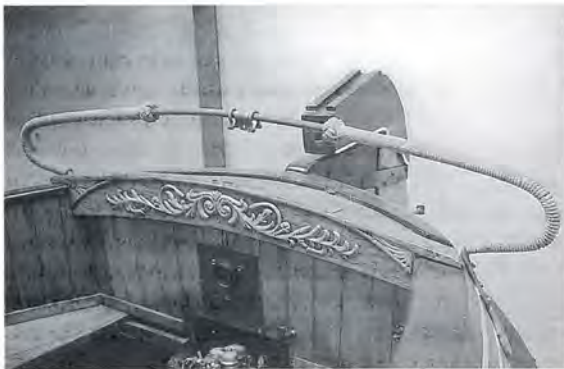
"Dieuwertje D", hennebalk