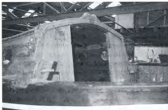
"Dieuwertje D", kajuitfront