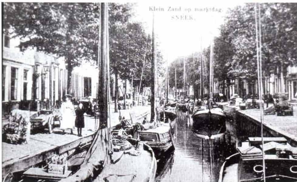
Zo lagen de scheepjes in Sneek te wachten op hun beurt om weg te varen.