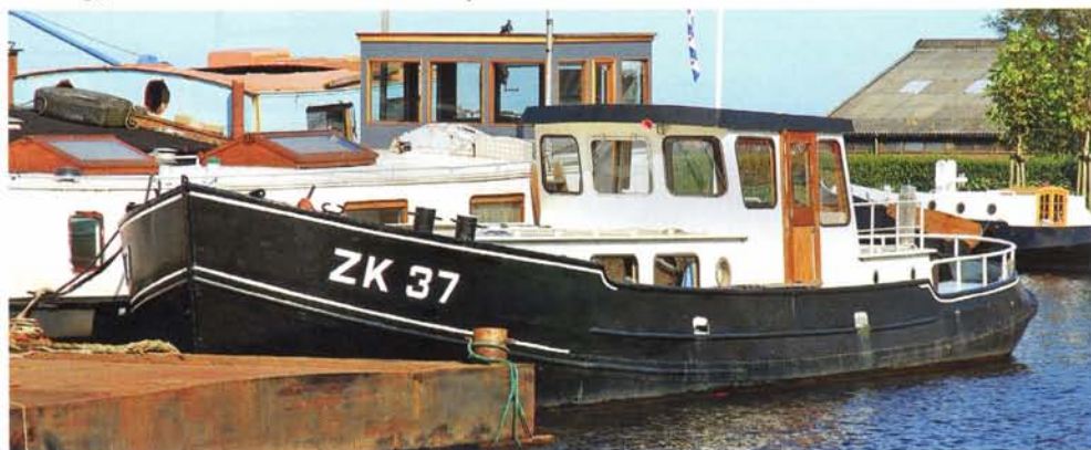
De ZK 37 als motorkruiser.

Usquert in Zoutkamp terecht. In 1949 wordt A. Frik Jzn. aldaar de nieuwe eigenaar. De naam van het schip wordt nu Twee Gebroeders en krijgt als visserijnummer ZK 37 en zal ruim 60 jaar in de familie blijven. In 1964 is zoon J.