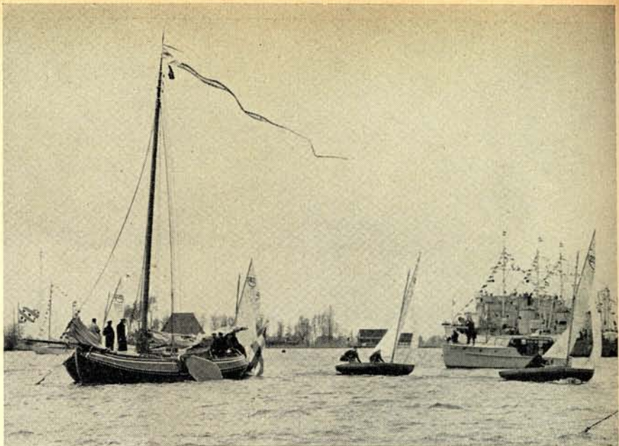
Het Statenjacht „Friso” voor anker liggend op het Pikmeer. De groep 16 m 2 jachten van het carousselzeilen groet de „Friso”. Op de achtergrond de drie mijnevegers van de Koninklijke Marine.

Halverwege de Wijde Ee keerde de „Friso” terug naar